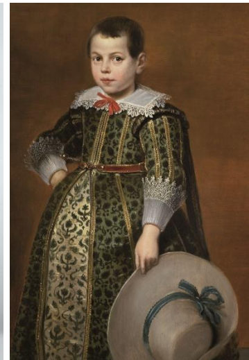
Cornelis De Vos, Portrait von Jan Vekemans , 1624