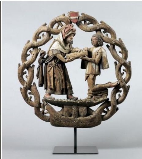
Brügger Werkstatt, Schild der Heilig-Blut-Prozession , 1529