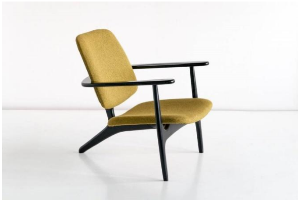
Alfred Hendrickx, Sessel S3 für Sabena, 1958