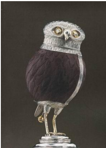
Eule mit der Stadtmarke Antwerpens, 1548-1549

Im Jahr 2026 hat die König-Baudouin-Stiftung doppelten Grund zur Freude: Sie feiert ihr 50-jähriges Bestehen und sie ist Ehrengast der BRAFA, der berühmten Brüsseler Kunstmesse. Diese Auszeichnung bezeugt die Anerkennung, die der Arbeit entgegengebracht wird, die von der König-Baudouin-Stiftung und ihren Philanthropinnen und Philanthropen seit vielen Jahren im Bestreben um die Erhaltung des belgischen Kulturerbes geleistet wird. Sie krönt ebenfalls die langjährige Partnerschaft, die die Stiftung und die BRAFA verbindet.