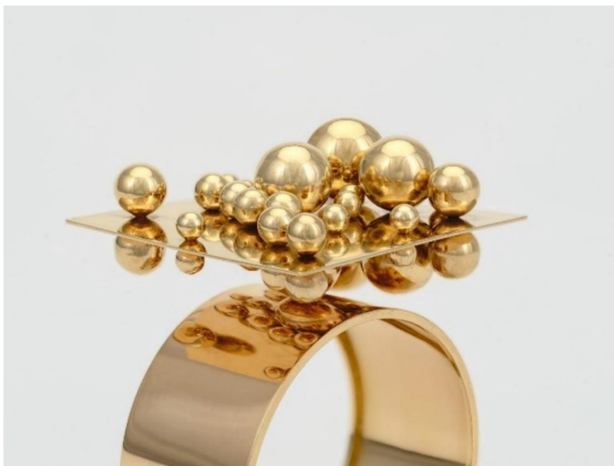
Pol Bury, Armband Boules des deux côtes d'un carré , 1968.