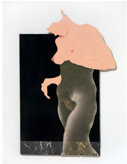
Evelyne Axell, L'égocentrique 2 , 1968.