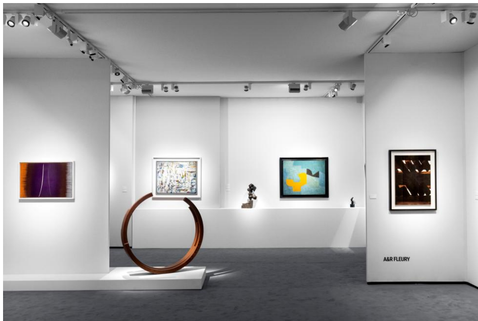
A&R Fleury, stand 52