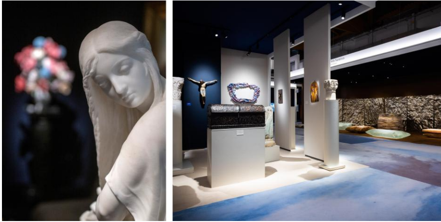
Artimo Fine Arts, stand 150 © Emmanuel Crooÿ/ Mearini Fine Art, stand 81 BRAFA 2026 © Olivier Pirard

Par ailleurs, la galerie a aussi cédé plusieurs poupées Fante ghanéennes de plus petit format, proposées à des prix inférieurs à 10.000 €, séduisant ainsi une nouvelle génération de collectionneurs. Ces acquisitions participent à l'établissement de relations durables et de confiance avec une clientèle renouvelée.