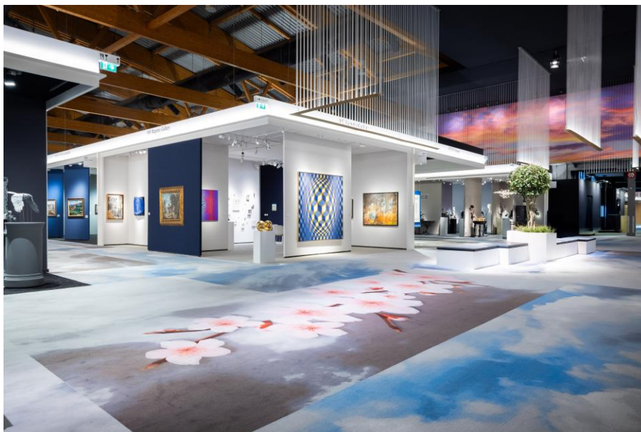
BRAFA 2026 Vue d'ensemble

Installée désormais à Bruxelles, la galerie WHITFORD (stand 87) a vendu plusieurs œuvres des artistes pop Clive Barker et Lacasse, ainsi que des céramiques d'Isabelle Nothomb. La galerie parisienne Brame & Lorenceau (stand 6), elle aussi très remarquée, annonce la vente de plusieurs œuvres, dont une grande toile d'André Lansky cédée à un nouveau collectionneur pour un montant proche de 150.000 €.