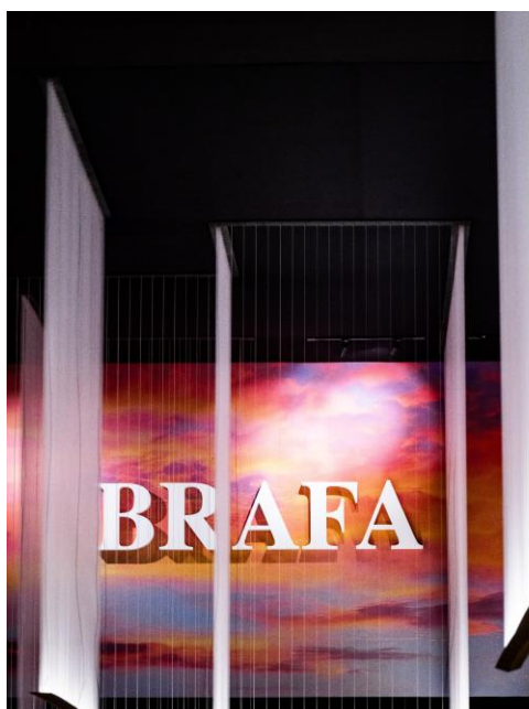
BRAFA 2026 Vue d'ensemble