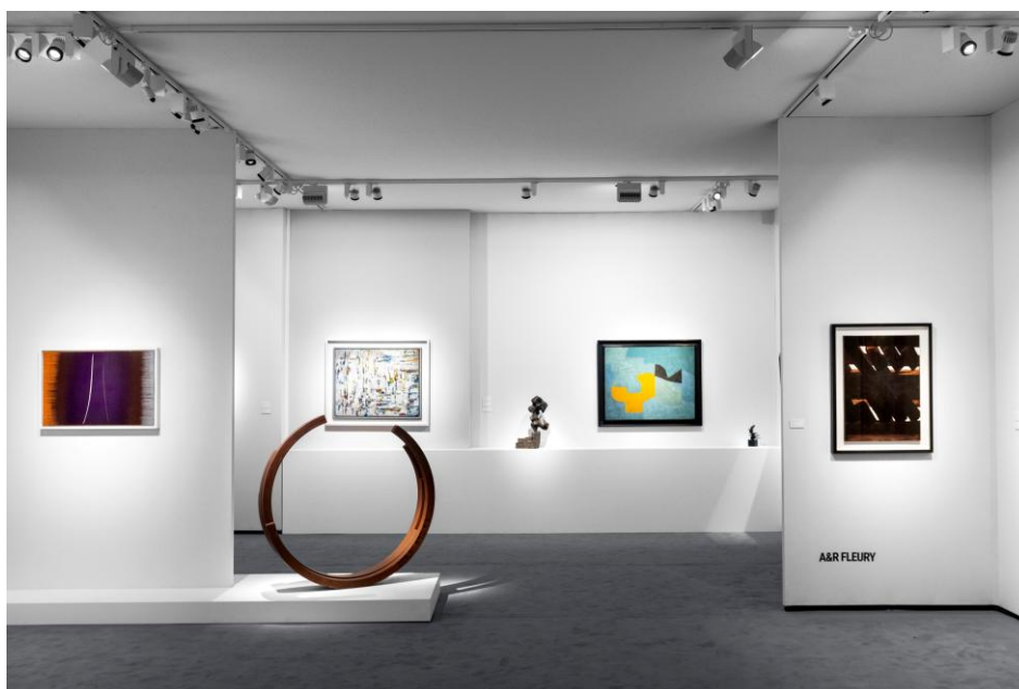
A&R Fleury, stand 52