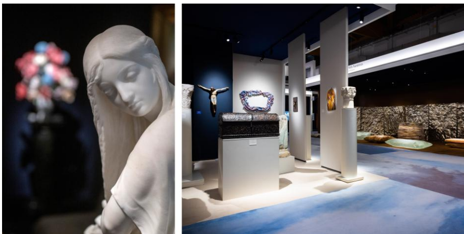
Artimo Fine Arts, stand 150 / Mearini Fine Art, stand 81 BRAFA 2026

Présenté par les nouveaux exposants Van Pruissen Asian Art (stand 18), un spectaculaire vase monumental japonais en bronze à décor de dragon, datant de la période Meiji, a trouvé acquéreur hors d'Europe. Sur ce même stand, un paravent japonais à six panneaux représentant des corbeaux, daté des années 1930, a également suscité un vif intérêt et s'est vendu avec facilité. Claes Gallery (stand 41), référence majeure en art tribal, annonce quant à elle la vente d'un important masque Dan-Mano pour un montant avoisinant les 150.000 €.