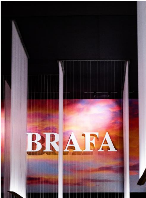
BRAFA 2026 Vue d'ensemble