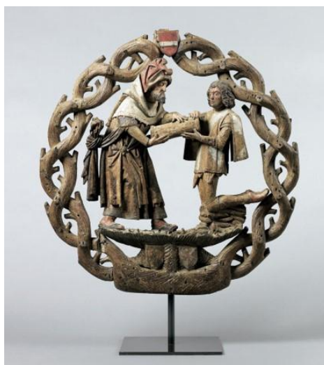
Atelier brugeois, Enseigne du Saint-Sang, 1529.