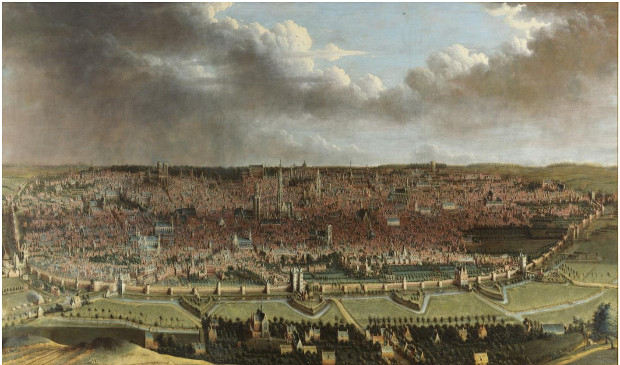
Jean-Baptiste Bonnecroy, Vue de Bruxelles , 1664–1665.