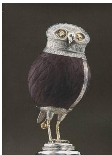
Chouette au poinçon d'Anvers, 1548-1549.

En 2026, la Fondation Roi Baudouin aura deux raisons de se réjouir : elle fêtera ses 50 ans et sera l'invitée d'honneur de la BRAFA, la prestigieuse foire d'art de Bruxelles. Cette distinction témoigne de la reconnaissance du travail accompli par la Fondation Roi Baudouin et ses philanthropes, qui s'engagent depuis de nombreuses années en faveur de la préservation du patrimoine belge. Elle vient également couronner le partenariat de longue date qui unit la Fondation et la BRAFA.