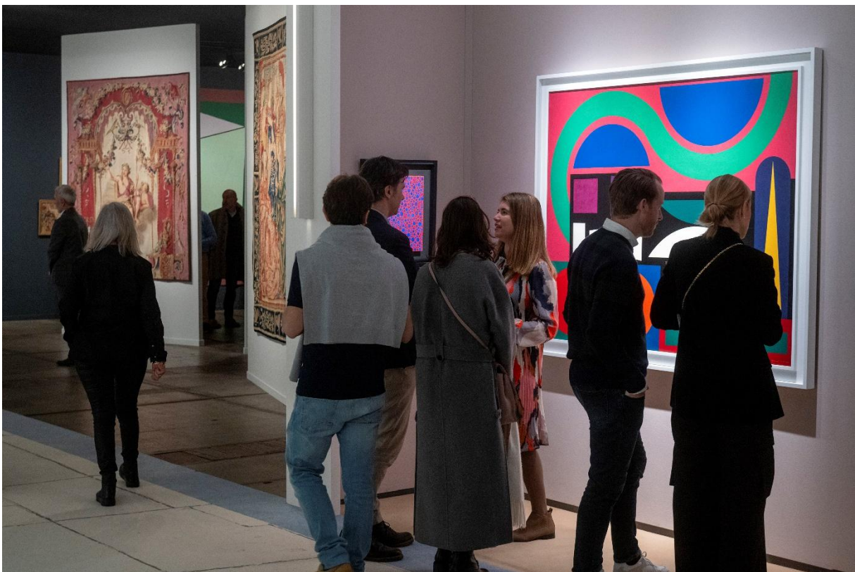
BRAFA 2024