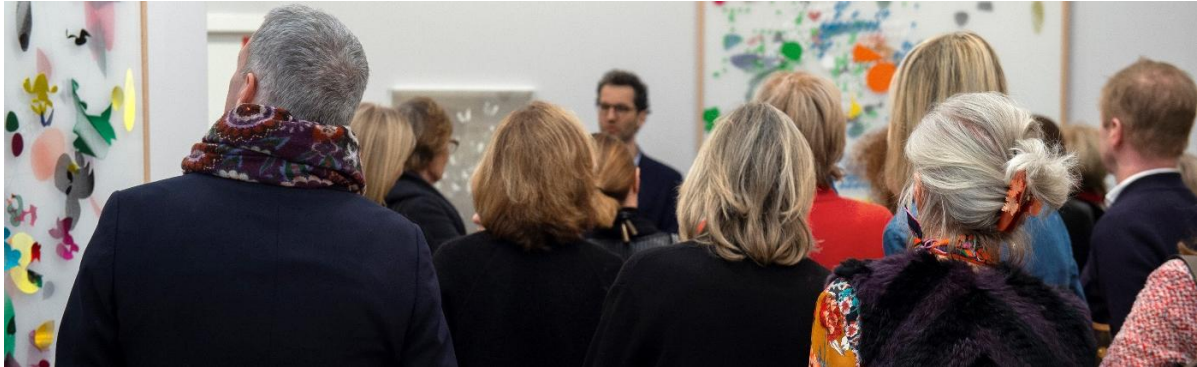
BRAFA Art Tours

BRAFA verrijkt jaarlijks haar programma met de BRAFA Art Talks voor de kunstliefhebbers, een reeks van boeiende lezingen door conservators, experts en andere sleutelfiguren uit de Belgische en internationale kunstwereld. Die lezingen vinden dagelijks plaats om 16.00 u. op de stand van de Koning Boudewijnstichting. Daarnaast worden ook dagelijks om 15.00 u. de BRAFA Art Tours georganiseerd, rondleidingen in het Nederlands, Frans en Engels, waarbij de bezoeker de tentoongestelde schatten diepgaand kan ontdekken.