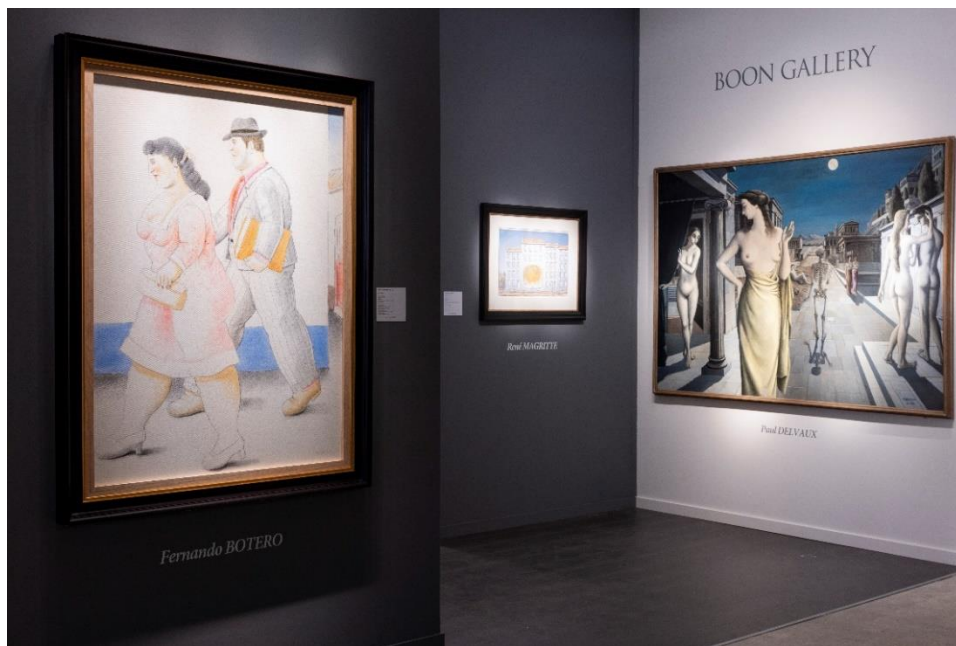
BRAFA 2024 – Stand Boon Gallery

La BRAFA se pare cette année d'accents surréalistes puisqu'elle célèbrera les 30 ans de la disparition du peintre belge, Paul Delvaux (Belgique, 1897-1994), dont la fondation est l'invitée d'honneur de cette édition. Celle-ci illustrera le parcours de l'artiste à travers une quinzaine d'œuvres dans un espace qui lui est dédié. A découvrir aussi sur les stands de plusieurs exposants, une trentaine d'œuvres mettant en évidence les thèmes récurrents chers à l'artiste : la femme, les gares et les trains, les décors antiques, la présence de squelettes. Boon Gallery (Knokke-stand 26) proposera un tableau intitulé La ville lunaire datant de 1944 (et dans un tout autre registre, une œuvre de l'artiste coréen Lee Ufan ainsi qu'un superbe Jean Dubuffet à ne pas manquer sur la Foire) et Francis Maere Fine Arts (Gand-stand 40) une œuvre nommée L'été , réalisée en 1963. La Galerie Taménaga (Paris-stand 87) exposera La tente rouge de 1966 et Opera Gallery (Genève-stand 107) une œuvre de 1968 intitulée La fin du voyage .