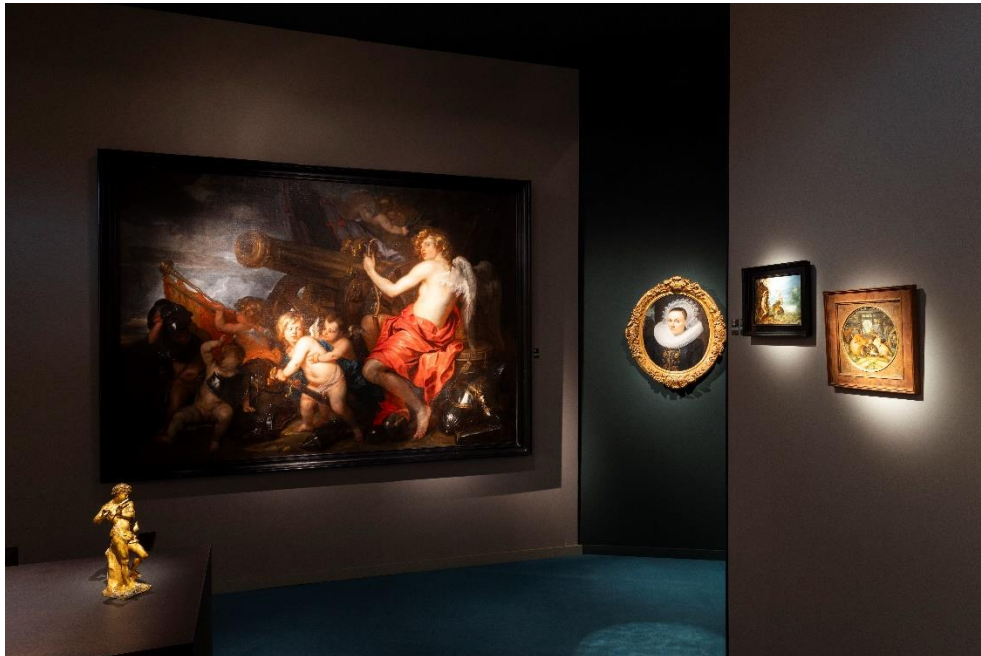
BRAFA 2024 – Stand Klaas Muller

La Galerie Florence de Voldère (Paris-Stand 25) mettra en avant une œuvre intitulée Adoration des Mages de Cornélis van Cleve (Belgique, 1520-1567) fils et élève du grand Maître anversois, Joos van Cleve (Belgique, 1485-1541) et Floris van Wanroij Fine Art (Dommelen-Stand 18) qui amènera notamment deux sculptures de qualité muséale, La Vierge et l'Enfant sur le croissant de lune , fin XVème siècle et La vierge et l'enfant , début XVIème siècle réalisées à Malines. Klaas Muller (Bruxelles-Stand 4) exposera de son côté notamment une grande œuvre baroque de Willeboirts Bosschaert (Pays-Bas, 1613-1654), Amor Triumphans , datant d'environ 1640-1645.