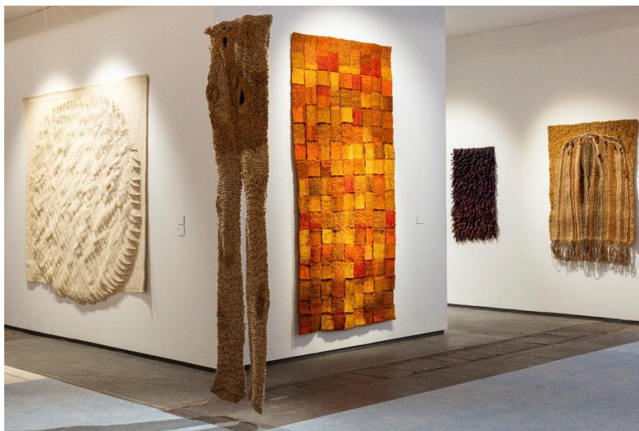
BRAFA 2024 – Stand Richard Saltoun

Tandis que la Galerie Hadjer (Paris-Stand 132) disposera sur son stand un ensemble de tapisseries de Fernand Léger (France, 1881-1955) réalisées en collaboration avec le célèbre atelier de tapisserie d'Aubusson, la Richard Saltoun Gallery (Londres-Stand 76) , présentera des œuvres textiles de femmes artistes d'après-guerre comme Jagoda Buić (Croatie, 1930-2022) avec son œuvre en laine Cercle dynamique , datant de 1976 et Ewa Pachucka (Pologne, 1936-2020, France) avec sa salopette intitulée The Trousers , 1969, en chanvre et sisal.