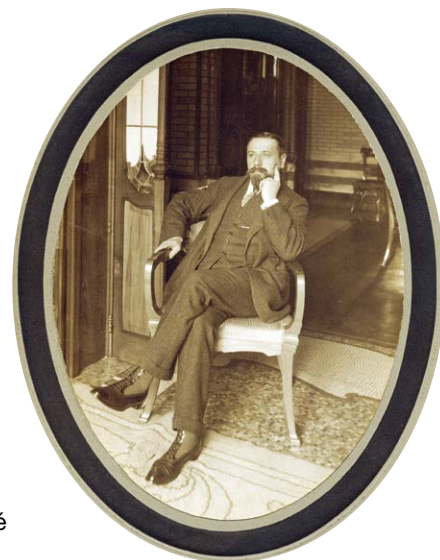
Portret Victor Horta (1861-1947).

In 2023 is het precies 130 jaar geleden dat het Brusselse 'Hotel Tassel' (Huis Tassel) werd ingehuldigd. Het gebouw, dat beschouwd wordt als het eerste architectonische werk in art-nouveaustijl, was een schepping van Victor Horta. De Belgische architect, die gezien wordt als dé belangrijkste vertegenwoordiger van de art nouveau, oogstte na de bouw van de woning uit 1893 onmiddellijk succes. Hij sleepte hierdoor diverse vervolgoopdrachten in de wacht, zoals het Solvay Huis en het Huis van Eetvelde. Alle drie prijken ze tegenwoordig op de Werelderfgoedlijst van Unesco. De vernieuwende art-nouveaureaties van Victor Horta vonden al snel navolging onder zijn collega-architecten, waardoor er in de verschillende Brusselse buitenwijken, zoals Schaarbeek, Etterbeek, Elsene en Sint-Gillis diverse gebouwen in deze stijl gebouwd werden. Veel van deze panden ontkwamen, tussen het einde van de Tweede Wereldoorlog en het einde van de jaren 60, spijtig genoeg niet aan het lot van de sloophamer. Desondanks telt Brussel nog altijd ruim vijfhonderd gebouwen in art-nouveaustijl.