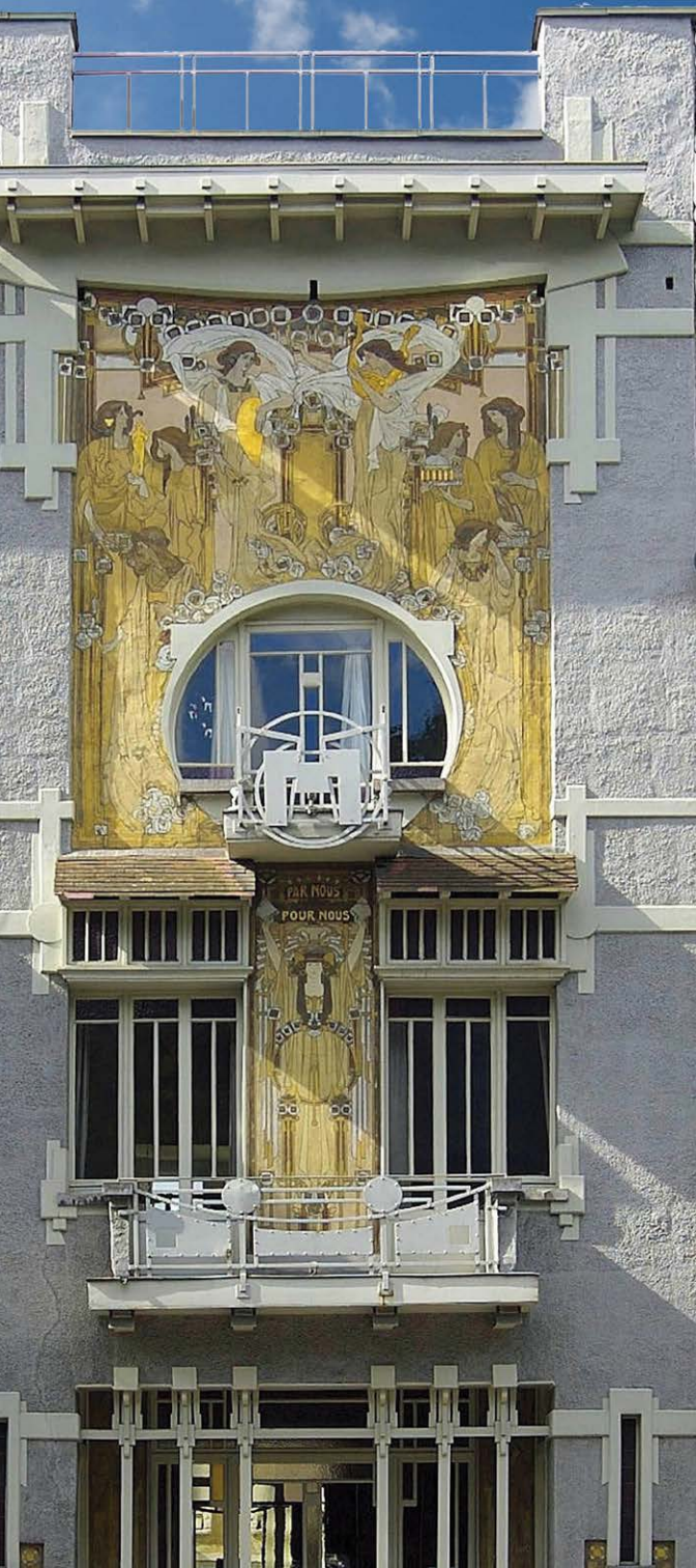
Maison Cauchie