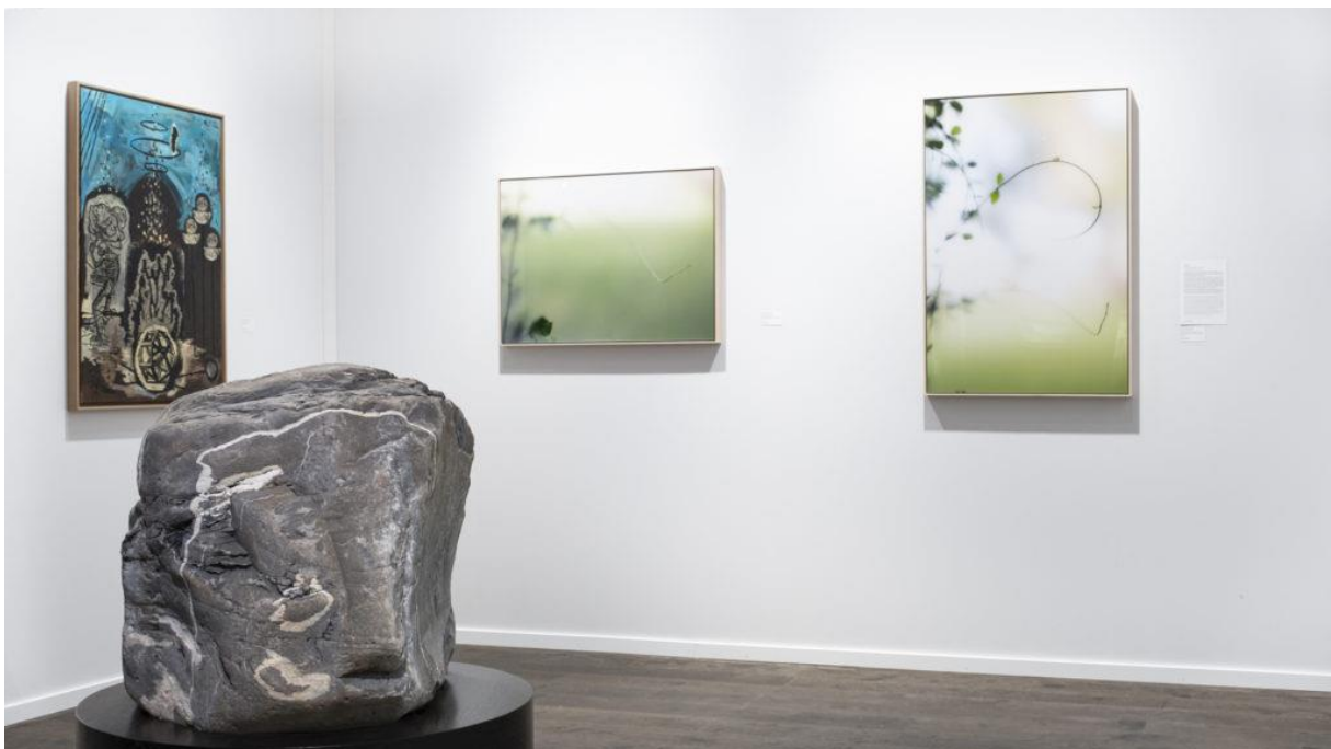
Vue du stand Nosbaum Reading

Repetto Gallery (Londres) : Arte povera en majesté avec Lucio Fontana (céramique) et Fausto Melotti et un important ensemble de Christo.