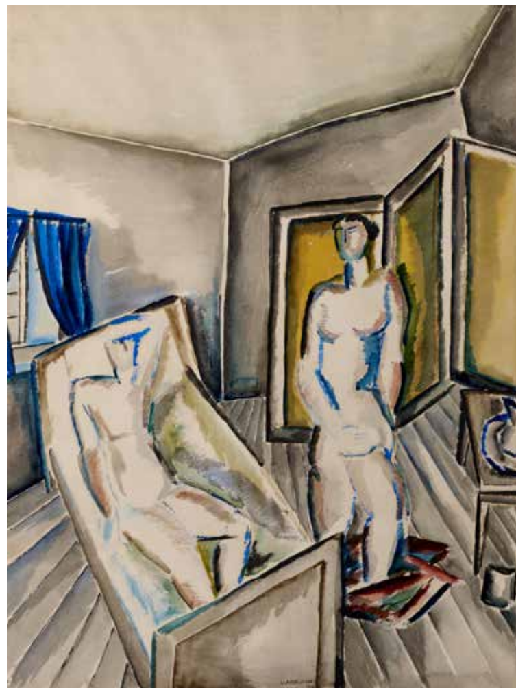
Осип Цадкин. «Пара в комнате», 1919. Галерея des Modernes