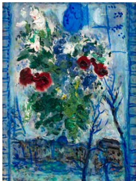
Марк Шагал. «Цветы в окне», 1959. Галерея Willow