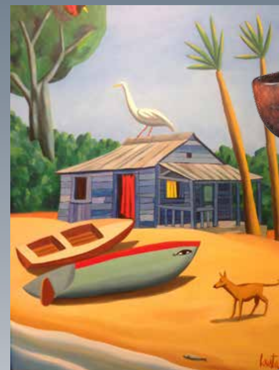
Женская статуэтка с чашей, XIX век. Ива Йоруба, Нигерия. Галерея Serge Schoffel