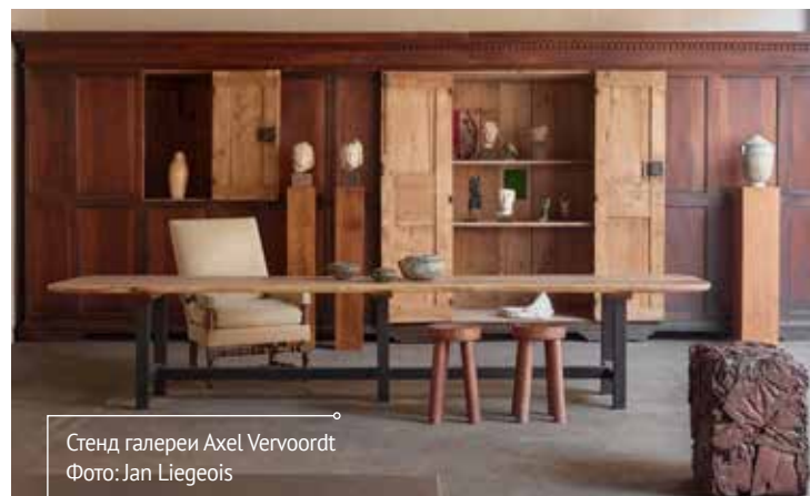
Стенд галереи Axel Vervoordt