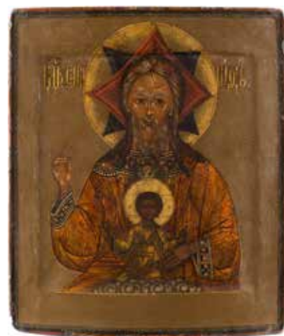
Икона «Бог-Отец», XVIII в., Россия. Галерея Brenske

Русское и советское искусство пользуется на BRAFA неизменным успехом. В этом году на ярмарке дебютировала московская галерея «Эритаж», став одной из 133 галерей-участниц