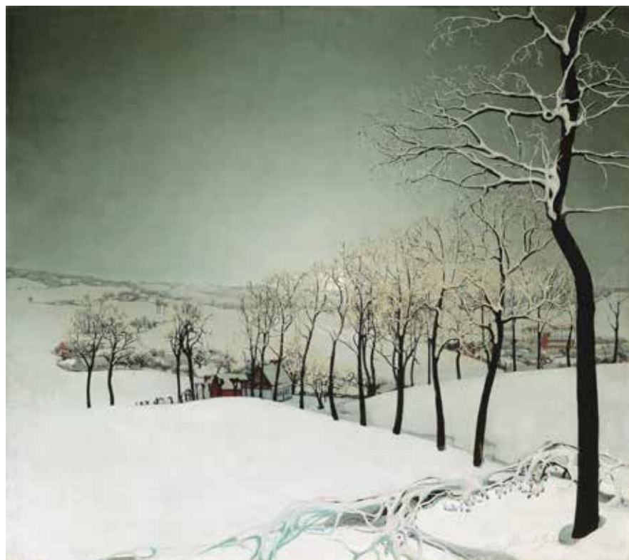
Валериус де Саделер. «Зимний пейзаж в сумерках», 1924. Галерея Oscar de Vos

Чтобы показать все экспонаты, представленные на BRAFA, понадобится не журнал, а толстая книга. Представляем те, что особо запомнились редакции