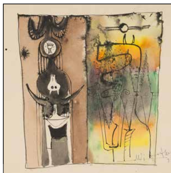
Вилфредо Лам. Без названия, 1949. Галерея des Modernes