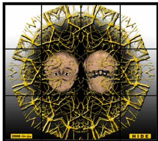
Гилберт и Джордж. HIDE, 2008. Галерея Albert Baronian