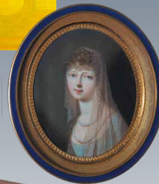
Доменико Босси. Портретная миниатюра на слоновой кости Великой княжны Марии Павловны, дочери императора Павла I и императрицы Марии Федоровны, 1804. Галерея Dario Ghio