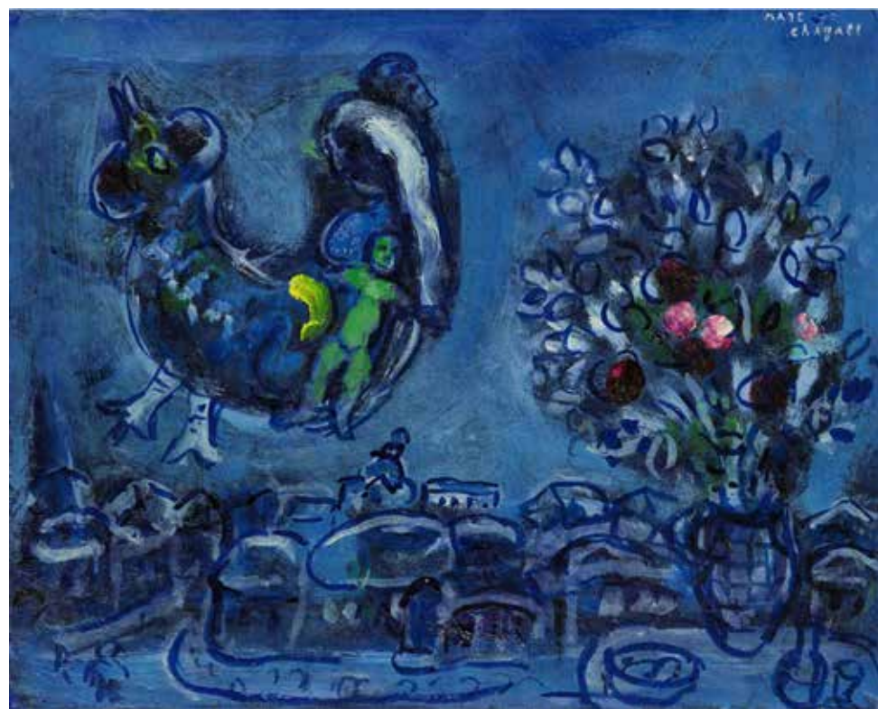
Марк Шагал. «Воспоминание о родной деревне», 1962. Галерея Stern Pissarro