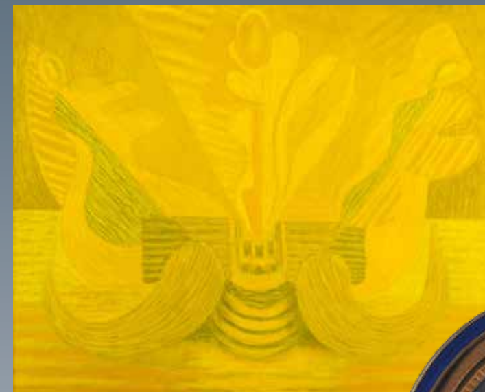
Серж Шаршун. «Гондола №35», 1953. Галерея Patrice Trigano