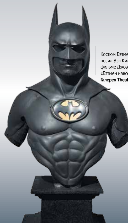
Костюм Бэтмена, который носил Вал Килмер в фильме Джоэла Шумахера «Бэтмен навсегда», 1995. Галерея Theatrum Mundi

На BRAFA традиционно представлено африканское, классическое, модернистское и современное искусство