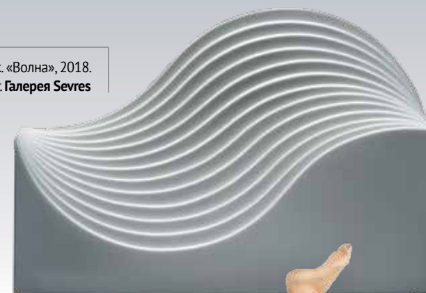
Хулио Ле Парк. «Волна», 2018. Фарфоровый бисквит. Галерея Sevres