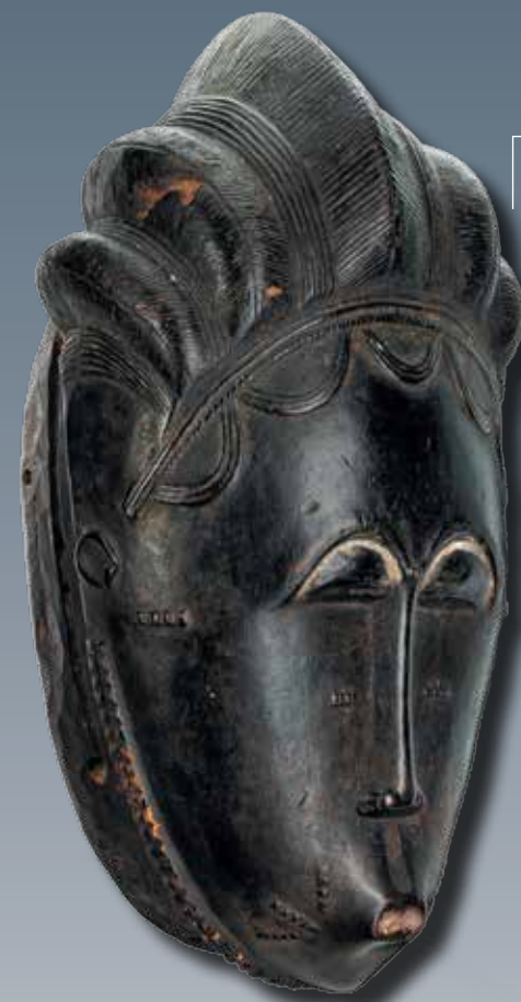
Маска народа бауле, конец XIX в. Кот-д'Ивуар. Галерея Didier Claes