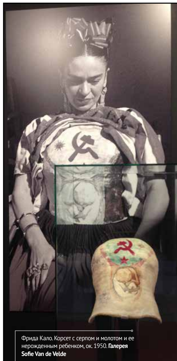
Фрида Кало. Корсет с серпом и молотом и ее нерожденным ребенком, ок. 1950. Галерея Sofie Van de Velde