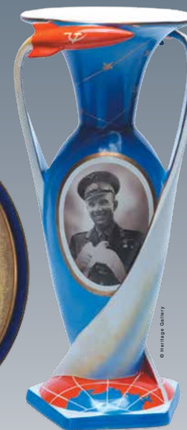
Евгений Никитин. Фарфоровая ваза «Космос» с портретом Юрия Гагарина, 1960-е. СССР. Галерея «Эритаж»