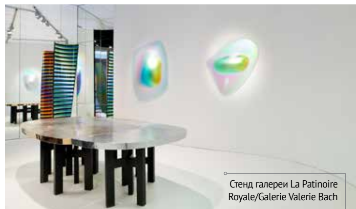
Стенд галереи La Patinoire Royale/Galerie Valerie Bach