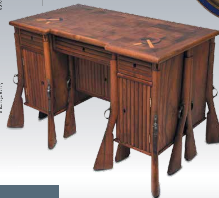
Стол на ножках из винтовок, 1920-1930-е. СССР. Галерея «Эритаж»