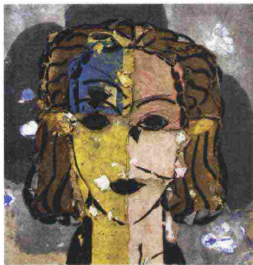
Manolo Valdes, Portrait on a gray background , 2013 (Opera gallery).

monumentale opera Three store fronts (1965-66). La proposta della fiera spazia come sempre dall'antico al Novecento, affiancando arti visive, antiquariato, arti primarie, numismatica e bande dessinée . Le gallerie sono 134, con 14 new entry di prestigio; dall'Italia giungono Chiale fine art, Il Quadrifoglio-Brun fine art, Robertaebasta, Tornabuoni e Theatrum mundi. Quest'ultima propone una "wunderkammer del 21° secolo", con opere e oggetti estremamente disparati: lavori di autori come Andy Warhol, ma anche tute di astronauti sovietici e memorabilia del film delle Tartarughe ninja. Un esempio sintomatico dell'eclettismo della fiera, indissociabile dalla qualità delle proposte.