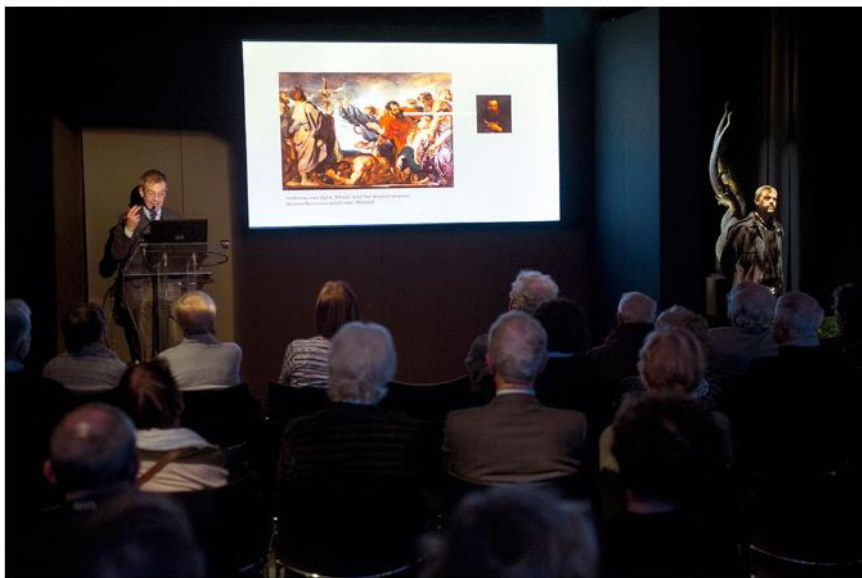
BRAFA 2017. Un'immagine da "Art Talks", incontri di approfondimento artistico svoltisi lo scorso anno nel corso della manifestazione. Il programma 2018 è consultabile nel sito www.brafa.art

La collaborazione tra BRAFA e Christo è nata in occasione della mostra Urban Projects all'ING Art Center di Bruxelles: una retrospettiva sui progetti urbani di Christo e Jeanne-Claude (moglie e collaboratrice) aperta fino al 25 febbraio in Place Royale 6.