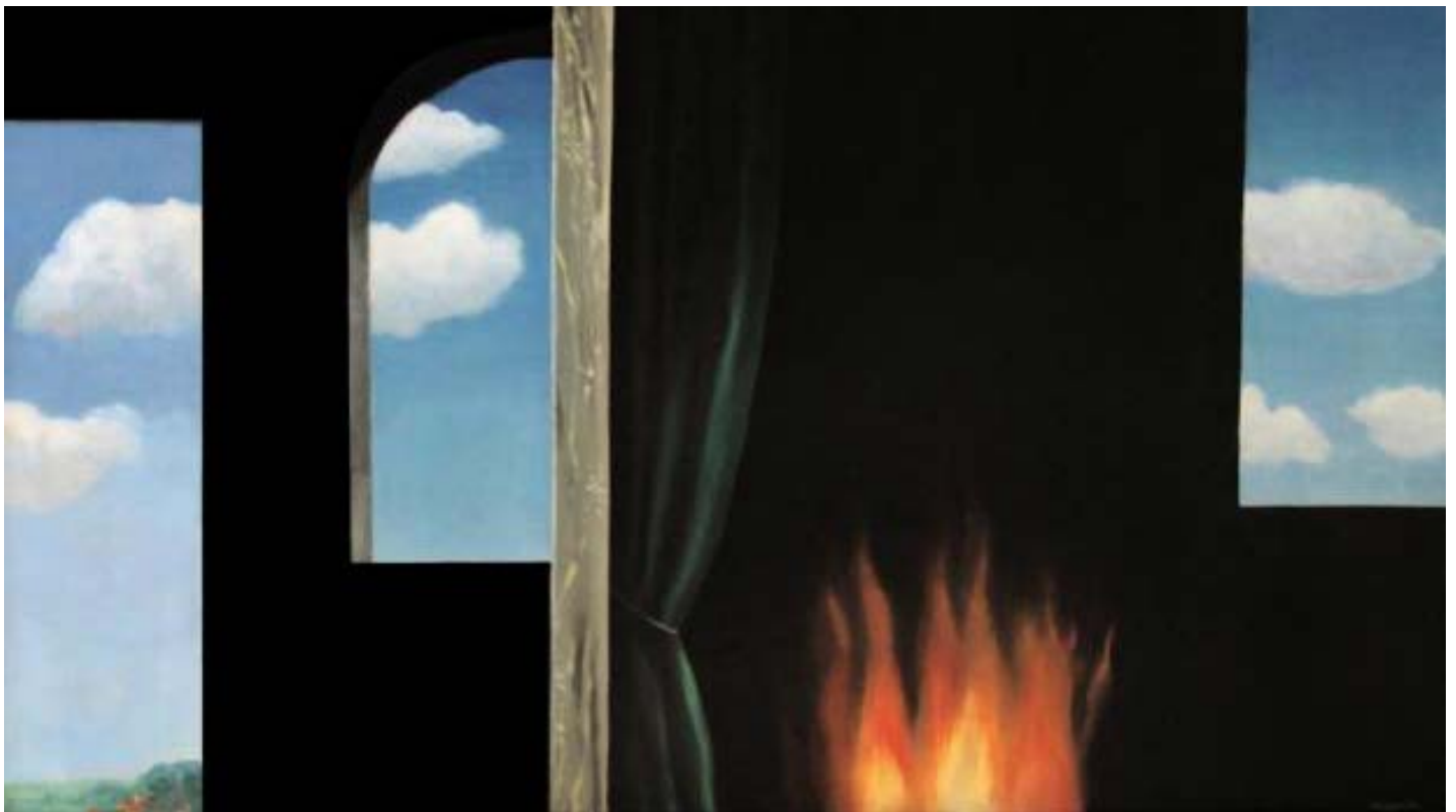
«L'Oracle», de René Magritte