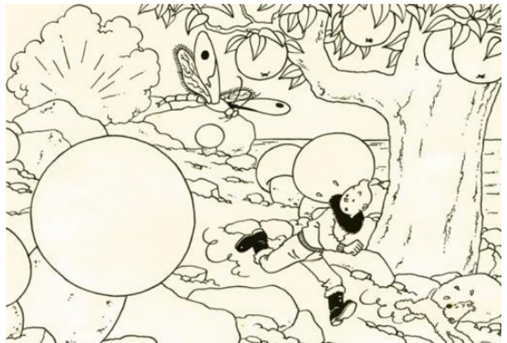
Uno de los dibujos de Tintín presentes en la feria