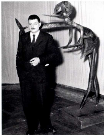
ci-dessus Reinhouid d'Haese.