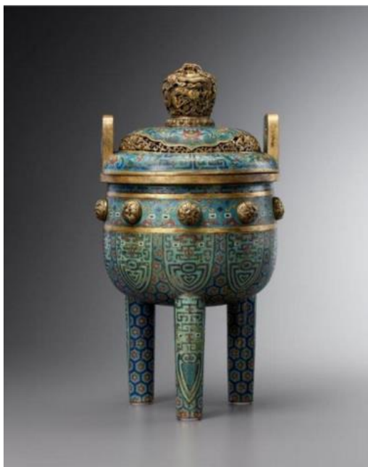
Brûle-encens en émaux cloisonnés Epoque Qianlong (1735-1796) galerie Grusenmeyer-Wöllner

Et bien entendu, comme nous sommes en Belgique, il ne faut pas oublier la bande dessinée. Vous y verrez des petits bijoux, des pages d'albums d'Hergé et de tous les créateurs de la ligne claire inspirés par Tintin, le héros national.