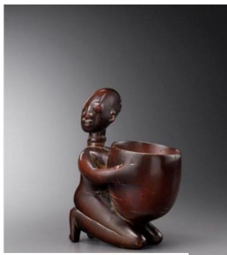
Coupe divinatoire Yoruba, Nigéria, vers 1060 Bernard de Grunne Tribal Fine Arts

La BRAFA est également réputée pour ses antiquaires « Haute-Epoque ». C'est l'endroit idéal pour trouver une Vierge de Mallines ou d'Anvers, contempler de superbes retables, acquérir des statues de Saints d'un gothique flamboyant somptueux. On y trouve même une galerie qui défend l'art de l'icône et propose des pièces rares, russes ou grecques datant du XVIe siècle.