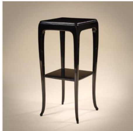
Jean Dunand (1877-1942) Table en laque noire, vers 1921 Galerie Mathivet

Dans une ambiance sympathique, décontractée et chic, typique du savoir-vivre belge, le visiteur parcourt le monde et les siècles à la recherche de l'objet qui le séduira au point de le vouloir au plus vite chez lui dans son salon. Le choix est vaste. Depuis de nombreuses années, les spécialistes de l'archéologie et de la plus Haute Antiquité ont affûté leur sélection et présentent souvent des objets exceptionnels. La démarche est la même pour les galeries qui défendent les arts d'Asie, d'Afrique ou d'Océanie.