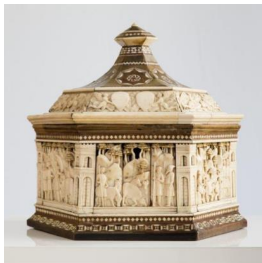
Coffre de mariage, scènes de la vie vénitienne, vers 1390-1410 Venise ou Florence Floriz Van Wanroij Fine Arts

Si la peinture ancienne n'est pas le point fort de la BRAFA, il n'en va pas de même des artistes modernes et contemporains. Les galeries les plus réputées du royaume et celles qui viennent de l'étranger y exposent les plus belles signatures.