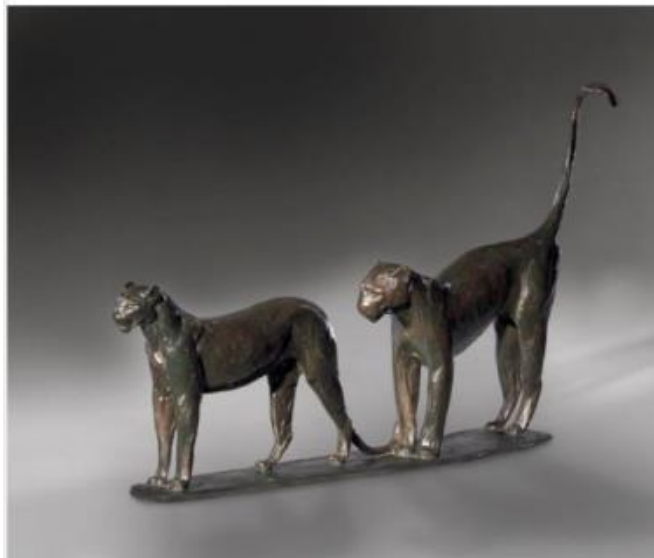
Rembrandt Bugatti (1884-1916) Jeunes léopards Galerie La Beraudière