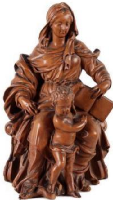
Vierge à l'Enfant Attribuée à Hendrik Frans Verbruggen (Anvers, 1654-1724) Galerie De Pauw-Müller

Non Classé / marche-de-l-art, publié le 17/01/2017 à 17:44 , mis à jour à 17:52:52