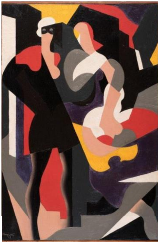
René Magritte (1898-1967) Nocturne, 1923 Stern Pissarro Gallery

Un froid polaire et un soleil radieux règnent sur la France et la Belgique. A Bruxelles, dans le bel espace Tour et Taxis, l'agitation est à son comble. Ouvriers et artisans munis de marteaux, scies et perceuses apportent la dernière touche aux stands de la BRAFA sous la surveillance attentive des décorateurs, des antiquaires et des organisateurs du salon qui veulent accueillir les amateurs dans les meilleures conditions.