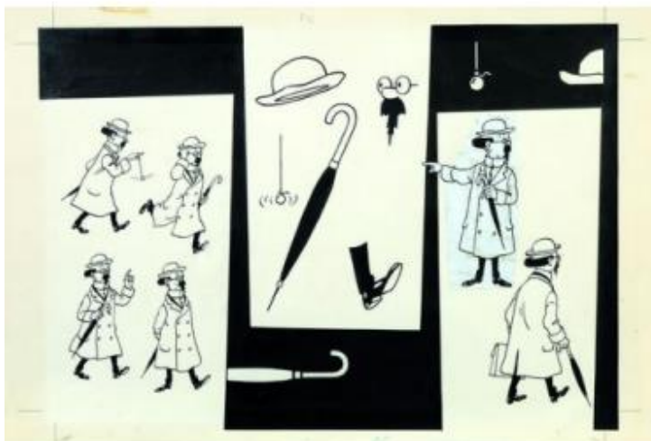
Hergé (1907-1983) Portrait de Cuthbert Calculus, le professeur Tournesol, 1968 Belgian Fine Comic strip Gallery

Et même pour des pièces rares, les prix annoncés ne sont pas excessifs. Il faut ainsi compter 50 000 euros pour une fort belle vierge anversoise du XVII e siècle, 85 000 euros pour un flamboyant vase Art nouveau de Philippe Wolfers et 240 000 euros pour un « Professeur Tournesol » d'Hergé dont les prix atteignent pourtant la stratosphère. C'est bien là que la BRAFA affirme son originalité. Exigeante, élitiste quant à la qualité des objets présentés, elle reste accessible. En somme, c'est le label « qualité belge » au service de l'art.