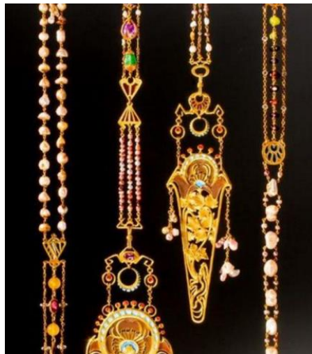
Chaîne de corsage Art nouveau Georges Fouquet (1862-1957) et Alphonse Mucha (1860-1939) Epoque Fine Jewels

Si vous voulez acheter commodes, meubles, armoires, fauteuils et chaises vous aurez bien du mal à vous décider. Du grand mobilier classique du XVIIe et XVIIIe siècle, souvent présenté par des galeries françaises, on passe aux délicats ensembles créés sous la Restauration pour aborder ensuite l'Art nouveau et l'Art déco.