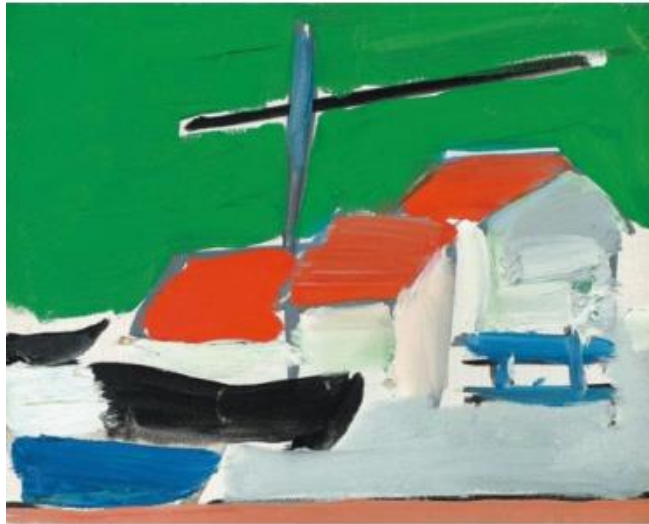
Nicolas de Stael (1914-1955) Les Mardiques, 1954 Bailly Gallery

Mais cette bonification ne se fait pas au détriment du portefeuille du visiteur. Si l'on trouve des œuvres à des prix considérables, on peut également acheter toute une foison de très beaux objets pour moins de 5 000 euros.