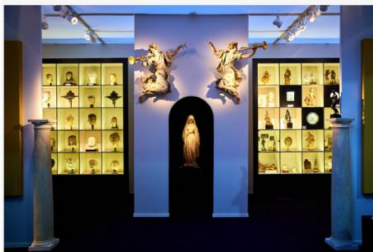
GALERIE SISMANN