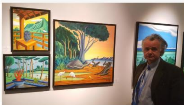
Jacques de Loustal

peu à la manière des gens du cinéma. Ces tableaux représentent la partie visible de mon travail. C'est ma zone de confort, celle que je maîtrise et que mes lecteurs connaissent. Par contre, la peinture à l'huile m'emmène dans des zones plus inconnues, plus douloureuses aussi car beaucoup plus difficiles ». L'ensemble des œuvres donnent un contraste saisissant entre ses panoramiques à l'aquarelle et ses toiles à l'huile qui ont un côté un peu expérimental.