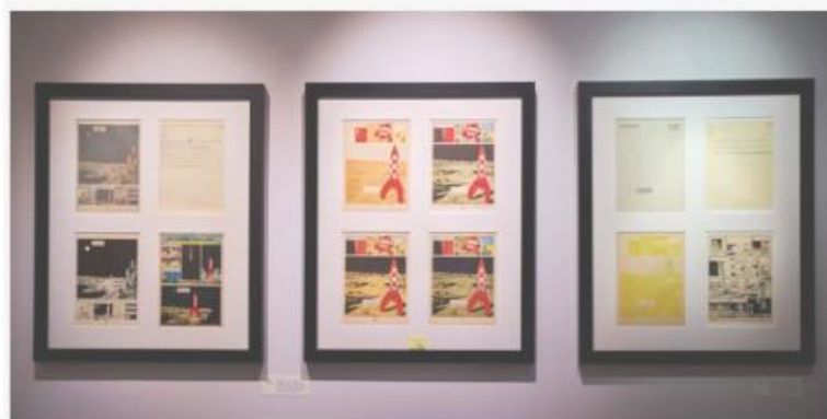
BELGIAN FINE COMIC STRIP GALLERY

Autre nouveauté à la BRAFA, l'hommage rendu à un artiste durant toute la durée l'évènement. Le choix des organisateurs s'est porté sur le sculpteur et peintre argentin Julio Le Parc , précurseur de l'art cinétique et de l'art optique. Quatre œuvres : le Continuél Mobile, la Surface Couleur et deux Sphères (l'une rouge et l'autre bleue), des structures de grande dimension, sont installées dans des endroits stratégiques de la foire.