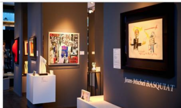
BOON GALLERY

Périodicité : En continu Diffusion : NC Catégorie : Internet