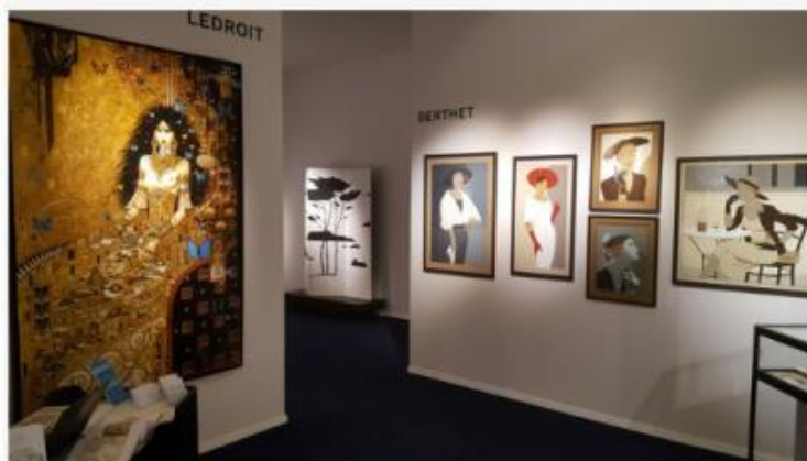
Galerie Huberty & Breyne

Périodicité : En continu Diffusion : NC Catégorie : Internet