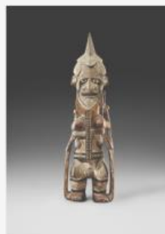
'Uli' Ancestor figure - Galerie Didier Claes

On ne change pas une formule qui gagne, dit l'adage. Mais on peut l'améliorer par petites touches. Fort d'un record d'affluence de plus de 58 000 visiteurs l'an dernier, les organisateurs ont reconduit leur stratégie pour cette 62 e édition. Nous l'avions dit, un nombre d'exposants quasi identique à l'an dernier ont été conviés, parmi lesquels treize nouveaux noms font leur apparition : citons la Belgian Fine Comic Strip Gallery, qui occupe la place laissée vacante par la galerie Champaka dans la liste des représentants du 9 ème Art. Elle propose une série de dessins originaux et des "Collectors remarquables" de Hergé. Cette galerie luxembourgeoise fondée par Bernard Soetens et Olivier Van Houte , spécialisée dans la recherche des meilleurs dessins originaux et grandes pièces de collection de l'École Belge, dite "de Bruxelles" ( Le Journal de Tintin ) et "de Marcinelle" ( Le Journal de Spirou ) s'est faite un nom dans le milieu de la Bande Dessinée de collection grâce à l'organisation depuis 1990 des "Ventes Scriptura".