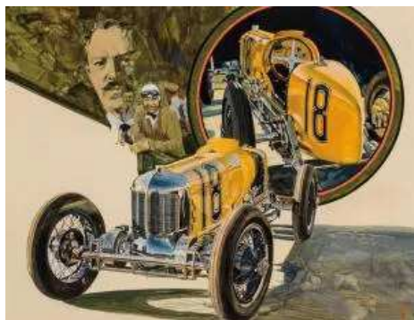
« Mantania F002 »

Roi Georges V d'Angleterre , un gentleman au cigare, que l'on découvre à l'arrière d'une dame vêtue de rouge, pratiquement au centre de l'oeuvre.