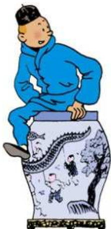
« Le Lotus Bleu »