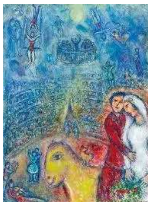
« Les Fiancés du Cirque » (1982)

A l'entrée de ce stand, voisinant l'un des couloirs, 25 peintures de l'américain Thomas Maclay Hoyne (1924-1989) sont accrochées, représentant d'anciennes voitures (1901-1937), une commande d'un collectionneur, William F. Harrah , qui, propriétaire de Casinos, possédait près de ... 1.400 véhicules, dont certains sont aujourd'hui exposés au « Musée National de l'Automobile ».