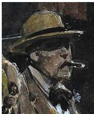
Détail de « Picadilly Circus »: Georges V (c) Fortunino Matania – « Berko Fine Paintings »

Jusqu'au dimanche 29 janvier, 16 pays sont représentés à la 62ème « BRAFA » par 132 antiquaires et galeristes. La particularité majeure de cette foire d'art des plus importantes au monde, outre qu'elle soit la première de l'année de dimension internationale, réside dans son éclectisme. A ce sujet, écoutons le Président de la « BRAFA », Harold t'Kint de Roodenbeke : « D'une certaine manière, notre foire d'art se présente comme un gigantesque cabinet d'amateur, mélangeant avec panache différentes sortes d'art. La 'BRAFA' s'inscrit dans la vision du collectionneur d'aujourd'hui, qui recherche la synergie entre époques et styles, pratique des croisements, s'ouvre à toutes les cultures, tend à une forme d'unité dans la diversité. Le mélange fait partie de notre quotidien, de notre mode de vie actuel, il est donc naturel qu'il se reflète aussi dans nos goûts et choix artistiques... Pour les collectionneurs comme pour les exposants, cette dizaine de jours constitue un moment fort de l'année, permettant des rencontres, des échanges des projets. La 'BRAFA' est un véritable musée éphémère, ... à la seule différence que tous les oeuvres y sont à vendre. »