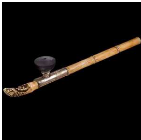
Pipe chinoise à opium

Les prix de vente de ceux qu'il expose à la « BRAFA » varient de 3.000 à 15.000€, voire davantage pour celui décoré en ivoire et en or massif. Autre pièce de collection, une pipe chinoise à opium . « Il s'agit d'une pièce rare, vu que des milliers de pipes à opium furent brûlées lors des deux 'guerres de l'opium' (1839-1842 et 1856-1860, nldr), ainsi que durant la « Révolution culturelle' (文革, en chinois, déclenchée en 1966, par Mao Zedong, nldr), s'attaquant à l'aristocratie et à la dépravation de l'être humain ».