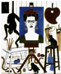
Abe Odedinda, The adoration of Frida part II, 2013 (galleria Ed Cross).

La London art fair, dedicata all' arte moderna e contemporanea britannica , riunisce quest'anno 129 gallerie (22% dall'estero). Gli autori vanno da nomi storicizzati come Lynn Chadwick ad artisti del Novecento da poco riscoperti come William Gear fino ai giovani. Alla sezione principale si affiancano quelle sulle giovani gallerie e sulla fotografia.