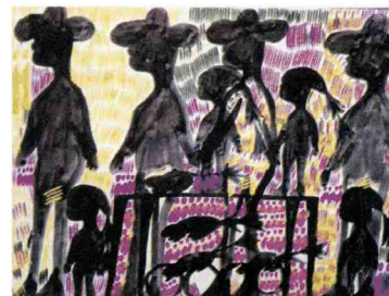
Carlo Zinelli, Senza titolo (recto), 1966 (galleria Rizoma Art brut).

L' Art brut è un settore in espansione anche a livello di mercato. La Outsider art fair se ne occupa da decenni con due edizioni a Parigi e New York. Quella di gennaio è la ventinovesima edizione newyorkese e ospita 60 espositori da 9 nazioni . Sono presenti anche due gallerie italiane: Maroncelli 12 di Milano e Rizoma Art brut di Parma, che presenta le opere di Carlo Zinelli (1916-1974).