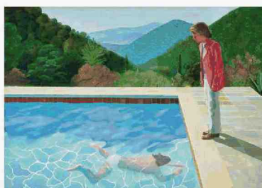
David Hockney, 'Portrait of an Artist (Pool with two figures)', 1972