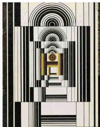
Albert Hollenstein, 'Hollenstein Phototypo', font design catalogue, 1971