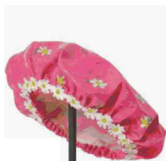
Jonathan Seliger, 'Pink Cap', 1994. Panza Collection, Mendrisio

Classici e moderni a Milano – La Galleria d'Arte Moderna in partnership con UBS propone un dinamico confronto fra le opere del museo e quelle di due grandi collezioni private, Panza di Biumo (foto) e Berlingieri. 'La finestra sul cortile', fino al 26/2, www.gam-milano.com Grafica a Zurigo – Si concentra su 22 figure chiave 'Les Suisses de Paris', i graphic designer svizzeri che dagli anni '50 in poi conquistarono la scena francese. Fra i nomi, Frutiger, autore del carattere Univers, Hollenstein (foto), Pfäffli. Museum für Gestaltung fino al 19/3, museum-gestaltung.ch Un maestro a Londra – La Tate Britain rende omaggio a David Hockney con una maxi personale, fra disegni, stampe, foto, video e gli ultimi dipinti, mai visti finora, dal 9/2 al 29/5, www.tate.org.uk Artigianato di oggi a Vienna – Strumenti, manufatti (in foto uno di Jochen Holz), live workshop sulle tecniche usate dai makers sono il nucleo di 'handiCRAFT', mostra che indaga sulle 'abilità tradizionali nell'era digitale'. Al Mak, fino al 9/4, www.mak.at +elledecor.it Art Fair a Bruxelles – La più antica rassegna antiquaria europea amplia l'offerta per i design lovers: 11 le gallerie dedicate, come Le Beau che propone Sottsass (foto), e Robertaeabasta con Ponti. 'Tour & Taxis' dal 21 al 29/1, www.brafa.be Effetti speciali a Tokyo – Tokujin Yoshioka prosegue la sua esplorazione del mondo della luce con 'Spectrum', installazione alla Shiseido Gallery fino al 26/3, fra scienza e poesia. www.tokujin.com +elledecor.it