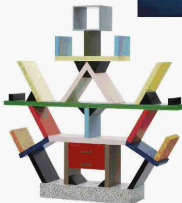
Ettore Sottsass, libreria-room divider Carlton, 1981