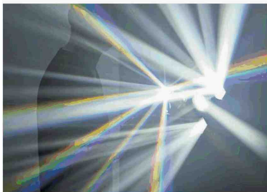
Tokujin Yoshioka, 'Spectrum', 2017