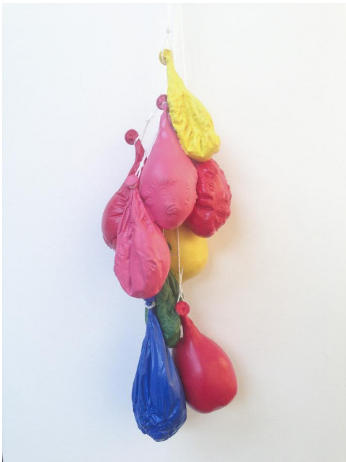
David Adamo, Untitled (red, yellow, blue, green), 2016, Bronze. Rodolphe Janssen