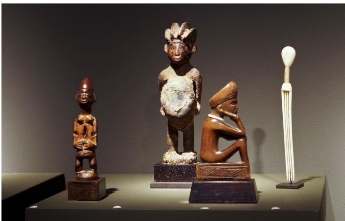
Kam, vrouwelijke vorm, Zuid-Afrika, 19e of begin 20e eeuw. Yann Ferrandin

Tussen de vele fantastische en soms enigszins angstaanjagende maskers en houten beelden van de tribal art galleries, viel deze elegante crêmekleurige haarkam ons op. Afkomstig uit Zuid-Afrika, gemaakt van bot.