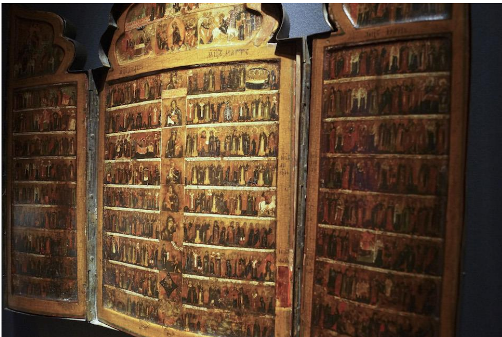
Portable calendar icon for the liturgical year, Russia, 18th c. Brenske Gallery

Niet dat dit een heel opvallend kunstwerk is – al zijn de details het bestuderen waard, zeker voor wie zich interesseert in de Oosters-orthodoxe Kerk – maar het idee dat dit gemaakt is als een handige inklapbare en draagbare agenda met alle christelijke feest- en herdenkingsdagen erin, vonden wij bijzonder geestig.