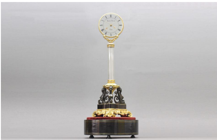
Jean Eugène Robert-Houdin, Triple Mystery Clock, Paris, circa 1850.

Drie mysteries: Hoe vindt het radarwerk in de voet van deze analoge klok van Robert-Houdin (1805-1871) een weg door de mini-beeldjes onderaan, het volledig glazen en doorzichtige middenstuk naar de wijzers midden in een even glazen en doorzichtige wijzerplaat? Wij weten het.