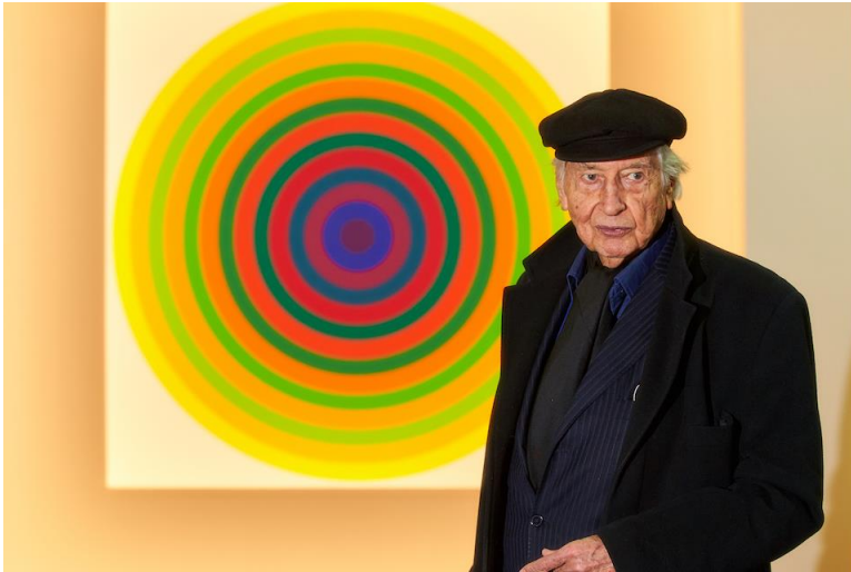
Julio Le Parc, Surface Couleur, 1970.

Onontkoombaar zijn de kunstwerken van Brafa-eregast Julio Le Parc, 87 jaar oud, godfather van de kinetische kunst en op-art. Bij binnenkomst kijk je tegen een enorm Continuel Mobile (1963) aan, op de beursvloer hangen twee Sphères van 2 meter doorsnee. Ongeveer in het midden van de beursvloer hangt zijn werk Surface Couleur. De meester zelf liep rond als een popster, poseerde voor fotografen, schudde de hand van heren en kuste de wangen van dames.