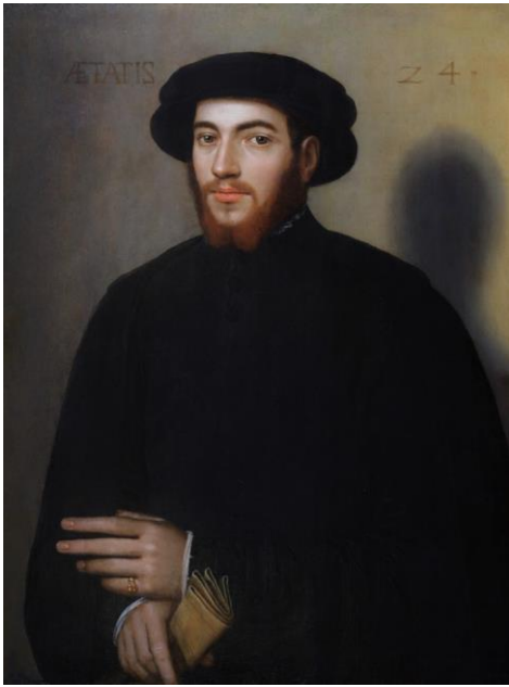
Willem Adriaensz. Key, Een portret van een jongeman. Floris van Wanroij Fine Arts