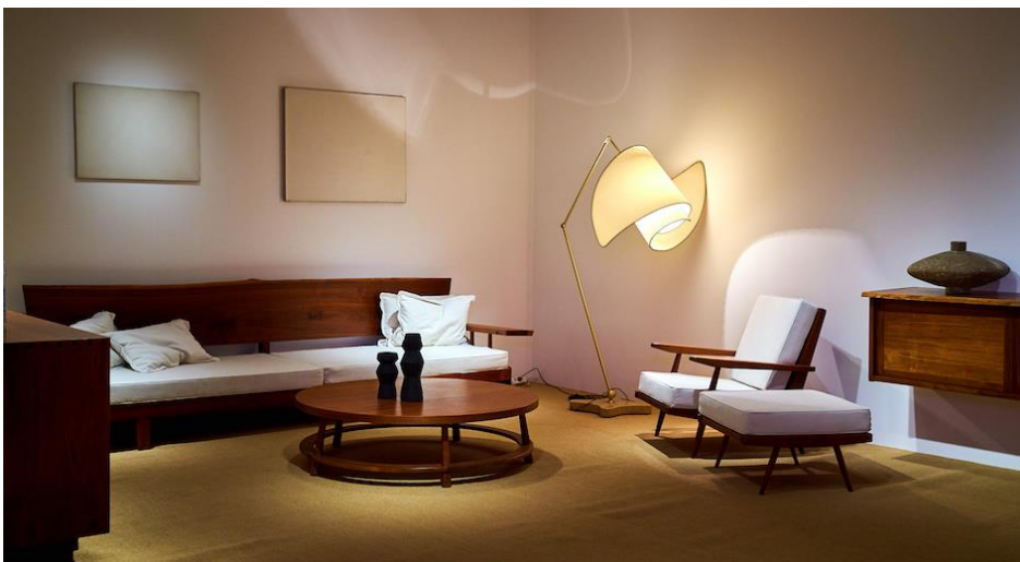
George Nakashima, Sofa, 1960. Frank Landau.

Wie van interieurdesign houdt, moet absoluut de stand van Frank Landau en Anita Beckers binnenlopen. De geweldige meubels – zowel elegante als robust – van Amerikaanse en Scandinavische makers ogen nog altijd even fris en modern als ze waren in de tijd dat ze vervaardigd werden.