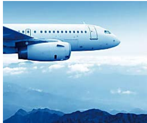
Ganga para Madrid: Vuelos Muy Baratos