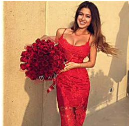
Los 10 Multimillonarios Más Ricos de España