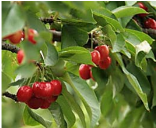
Cerezas y picotas, grandes aliadas de las dietas y del cerebro- Noticias y última hora de Antonio López F...