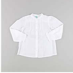
Top Top - 4,65 €- 5 Años quiquilo.es