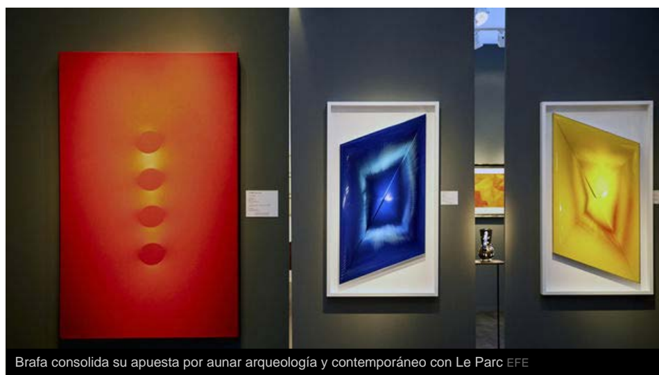
Brafa consolida su apuesta por aunar arqueología y contemporáneo con Le Parc

La veterana feria Brafa consolida un año más su importancia en el sector de la arqueología y las antigüedades, con piezas exquisitas y rarezas, mientras redobla su apuesta por el arte contemporáneo con el argentino Julio Le Parc como invitado de honor.