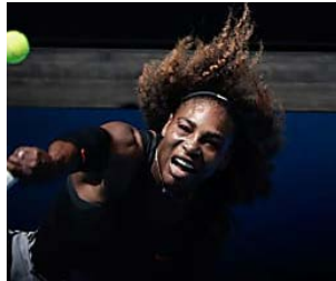
Serena logra los cuartos con esfuerzo y apunta a la final- Noticias y última hora de Tenis en Teinter...