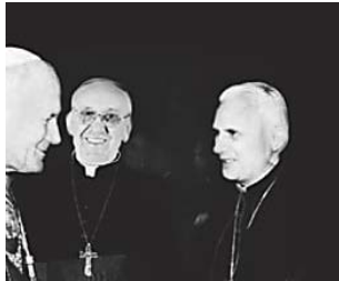
Juan Pablo II, Benedicto XVI y Francisco, tres Papas muy diferentes unidos por la oración- Noticias y últi...