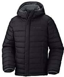
Powder Lite™ Puffer columbiasportswear.es