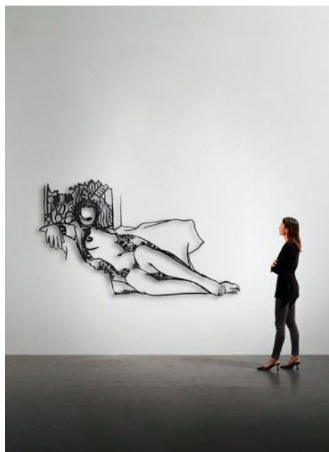
Monica Nude with Matisse, 1987 Enamel paint on laser-cut steel 128 x 218 cm

Het veilingrecord voor een werk van Tom Wesselmann bedraagt $ 10,7 miljoen en dateert uit 2008. Het spreekt voor zich dat de prijsklasse van de werken die op de Brafa-beurs tentoongesteld zullen worden aanzienlijk lager ligt, namelijk tussen 50.000 en 750.000 euro, maar het is aannemelijk dat Wesselmann wel eens één van de her-ontdekkingen zou kunnen zijn in de volgende jaren op de internationale kunstmarkt.