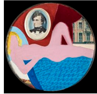
Little Great American Nude #1, 1962, Paint, plastic portrait, printed reproductions, fabric with pencil on metal plate, 17,8 cm

De eerste werken van Tom Wesselmann dateren van eind jaren '50, begin '60 en waren voornamelijk collages gemaakt van behangpapier en advertenties, soms gecombineerd met geschilderde naakten in Amerikaanse interieurs. Deze werken zijn uiterst zeldzaam en op Brafa zullen hiervan 2 kleine werkjes getoond worden.