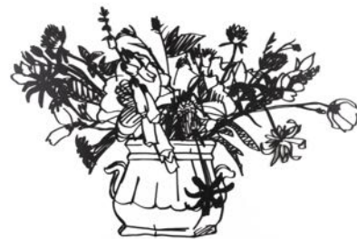
Wildflower Bouquet, 1988 Enamel paint on laser-cut steel 147,3 x 147,3 cm