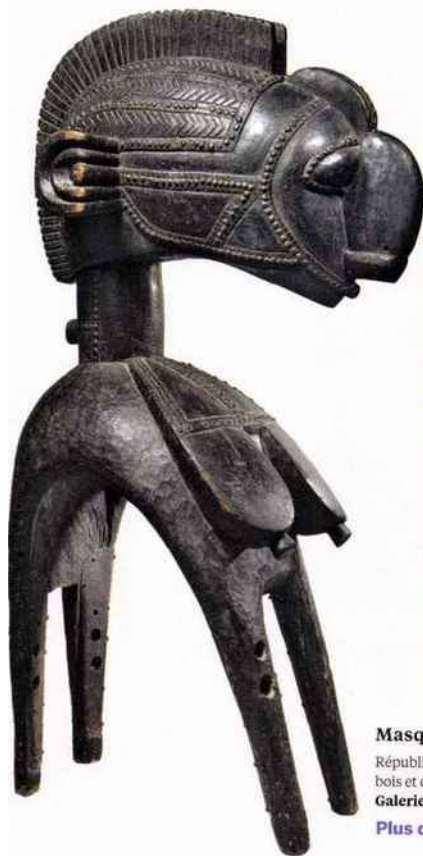
Masque d'épaule baka

Avec sa formule exemplaire qui choie les amateurs d'art modestes comme les gros collectionneurs, la foire belge a tout pour plaire.