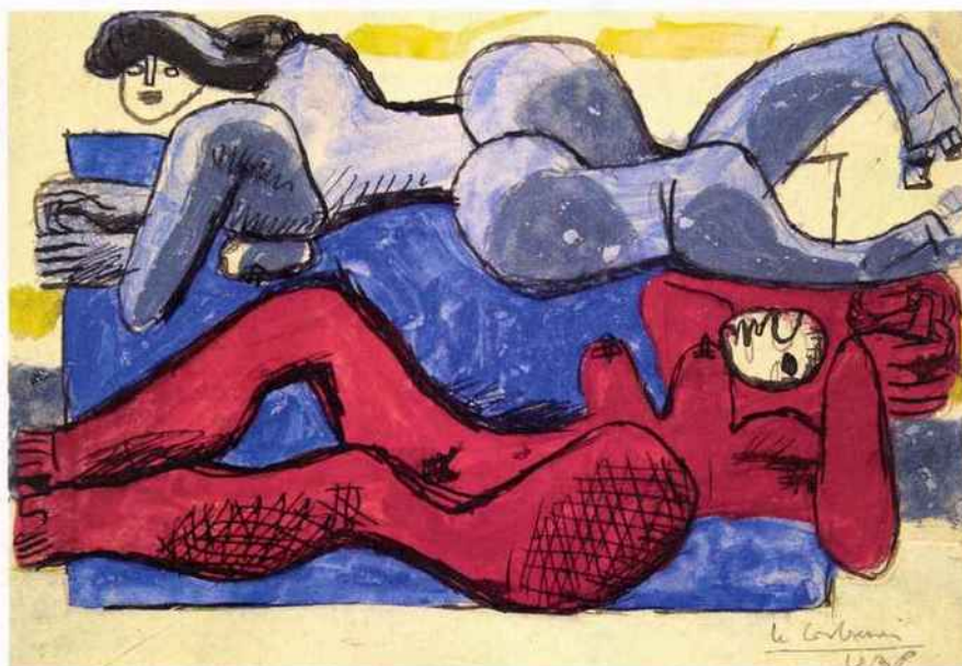
Le Corbusier Deux femmes allongées

1938, gouache, encre, aquarelle, mine de plomb et collage sur papier contrecollé sur carton, 20,7 x 30,4 cm. Galerie Brame & Lorenceau, Paris.