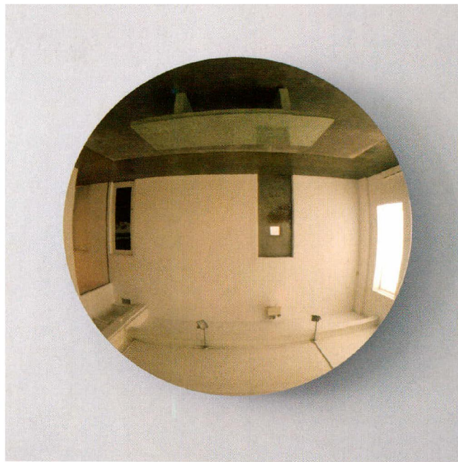
Anish Kapoor, Mirror Glow Bronze, 2015, brons en lak, 133,4 x 133,4 x 21,6 cm, Gladstone Gallery