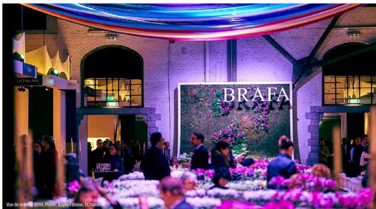
Vue de la Brafa 2018.

Dans une ambiance très détendue et conviviale s'est ouverte, le 24 janvier, la 63 e édition de la Brafa (Brussels Antiques & Fine Arts Fair) pour trois jours de vernissage, avant son ouverture au public le samedi 27 janvier. La première journée, réservée aux collectionneurs du premier cercle des 134 exposants, s'est clôturée par un dîner de 1850 convives dans les allées de la foire. Ces privilégiés étaient ravis de discuter de leurs premières découvertes et achats.