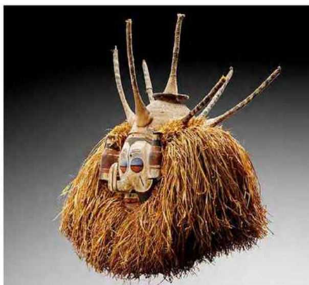
Masque de danse Yaka, RDC, fin XIX e -début XX e , bois polychrome et raffia, 66 x 40 cm.

La galerie genevoise Phoenix Ancient Art, qui s'est félicitée d'avoir vendu huit pièces (dont cinq de sa sélection «Young Collectors») en deux jours, présentait en vedette une sublime tête romaine en bronze de la période augustéenne (10-20 av. J.-C.), provenant de la collection américaine Hunt. Pour ce type de chef-d'œuvre à 3,5 millions d'euros, toujours en négociation à mi-parcours de la foire, les achats se font de façon plus réfléchi. Idem pour le spectaculaire et admiré tableau de la première moitié du XVII e siècle La Chasse de Diane et des nymphes , acheté dans une vente publique il y a deux ans par le marchand bruxellois Klaas Muller, identifié depuis par Arnout Balis (expert mondial de l'artiste) comme un authentique Rubens, assisté de deux peintres spécialisés: Paul de Vos pour les animaux et Jan Wildens pour le paysage, comme cela était