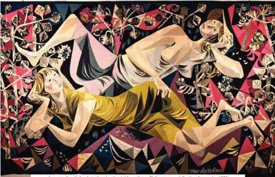
Au cours des siècles, la tapisserie a inspiré les artistes. Ci-dessus, une réalisation des années 1950 signée Julien Van Vlasselaer. En bas à gauche, un thème abstrait en laine et lin de Jo Delahaut, de 1989. À droite, le visage d'un évangéliste de l'une des tapisseries de la cathédrale de Malte en cours de restauration.