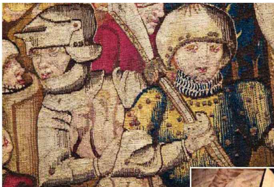
Chaque tapisserie nettoyée et restaurée à la manufacture repart avec sa signature brodée sur l'envers.