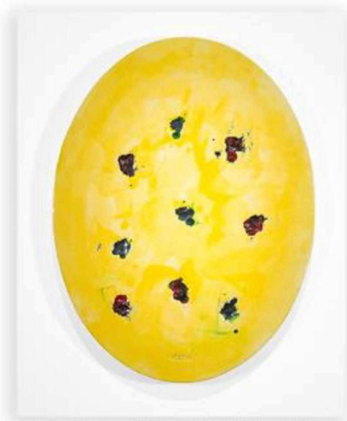
Abstractes Oval, Thomas Schütte, 2014