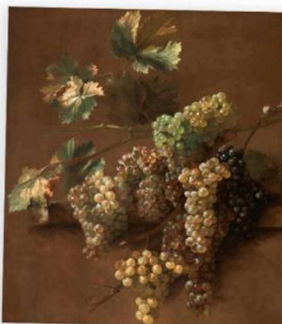
Grappes de raisin, Nicolas de Largillière (1656-1746), vers 1670