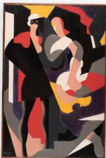
Nocturne, René Magritte, 1923