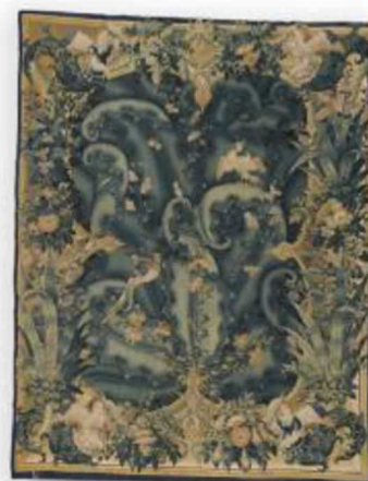
Feuilles de choux et oiseaux, XVIe siècle