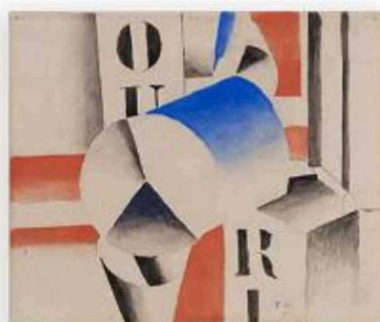
Le remorqueur, Fernand Léger, 1917