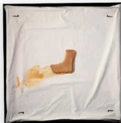
Quatre Claus, Antoni Tàpies, 2003