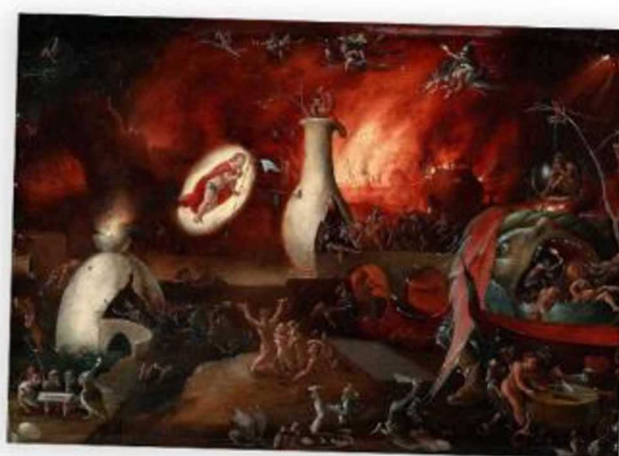
The Harrowing of Hell, Pieter Huys, XVIe siècle