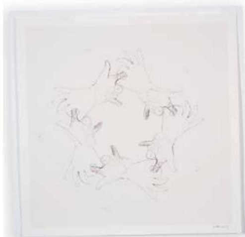
Untitled (from Fingers & Holes Series), Bruce Nauman, 1994