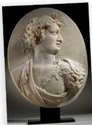
Bacchus, Domenico Parodi, XVIIIe siècle