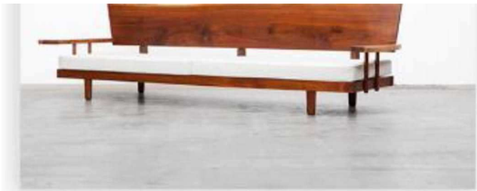
Banquette, George Nakashima, 1960