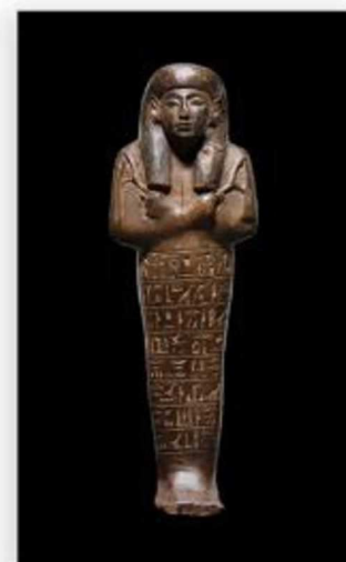
Shabti, Nouvel Empire, Entre 1295 et 1069 avant J.C.