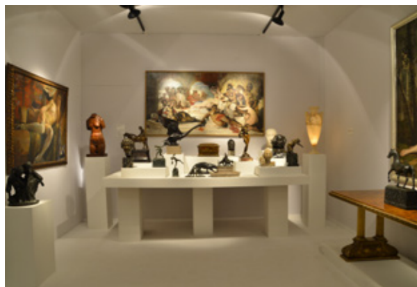
Bild oben: Le Couvent des Ursulines @ Brafa 2015 Bild mitte: Victor Werner @ Brafa 2015 Bild unten: Galerie Xavier Eeckhout @ Brafa 2015

Vom 23. bis 31. Januar 2016 nimmt die BRAFA Art Fair, als eine der wichtigsten und ältesten Kunst- und Antiquitätenmessen in Europa, wieder ihre Besucher in Brüssel in Empfang