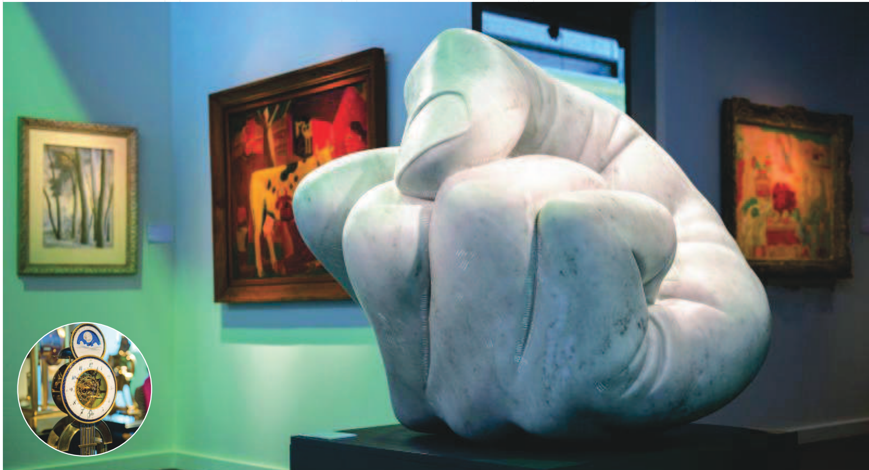
Francis Maere Fine Arts © EMMANUEL CROOY