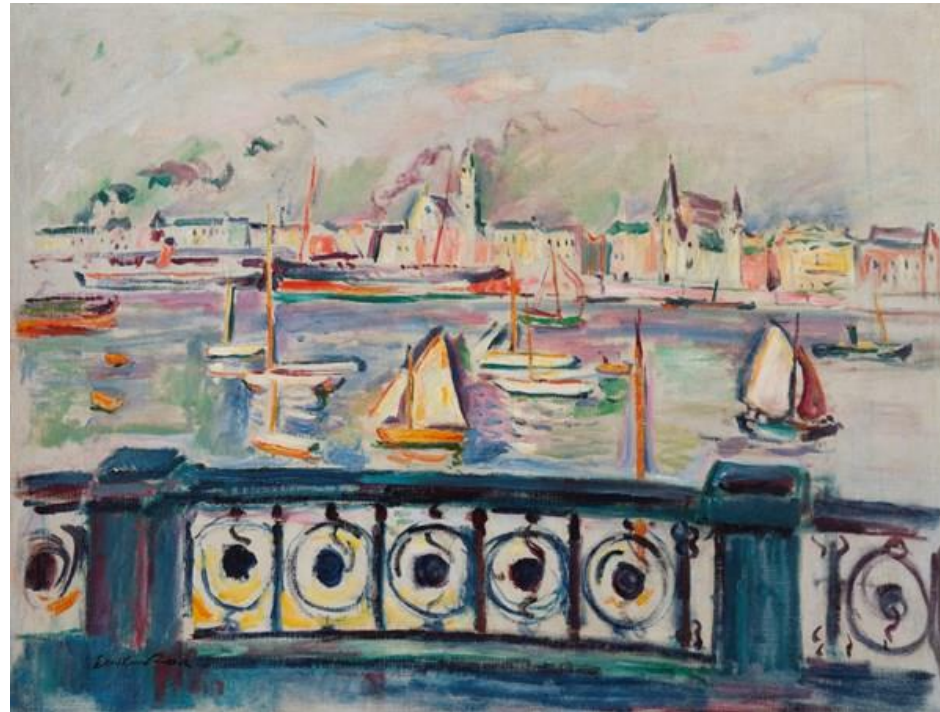
Emile-Othon Friesz (1879-1949), De Antwerpse haven, 1906

In de zomer van 1906 beslissen Georges Braque en Emile-Othon Friesz om hun vakantie door te brengen in België en het is tijdens deze reis dat de expressieve principes bepalend voor het fauvisme bij hen tot uiting komen. Ze verblijven in Antwerpen, aan de oevers van de Schelde, aan de ingang van de haven, en leggen zich enkel toe op marines, waarbij ze in hun artistieke onderzoek focussen op de bevrijding van de kleur. Dit schilderij is vervuld van een levendig licht en kenmerkt zich door een vrije penseelstreek en een explosie van zuivere kleuren. Emile-Othon Friesz trakteert ons hier op een origineel gezicht op de Antwerpse haven, vanaf het terras van het voormalige etablissement 'Kursaal', naast het voormalige casino 'Belvédère'.