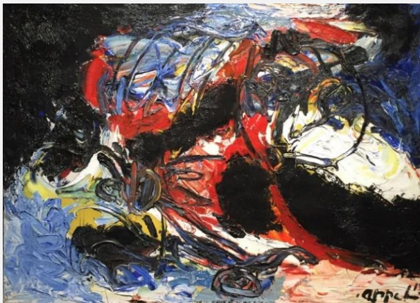
Galerie Boulakia – Karel Appel (Amsterdam 1921-2006 Zurich), Untitled , 1960