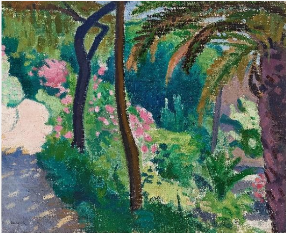
Dr Nöth Kunsthandel + Galerie – Albert Marquet (Bordeaux 1875-1947 Paris), Le Jardin à l'Estaque , 1918

Cette œuvre d'Albert Marquet (1875-1947) est plus petite et plus colorée que ses tableaux habituels à la tonalité plus grise. Pendant la Première Guerre mondiale, le peintre fauviste a passé la plupart de son temps sur la Côte d'Azur, principalement à Marseille et à l'Estaque (juste à l'ouest de Marseille), en compagnie de son ami de toujours, Matisse. Marquet n'a pas choisi la spectaculaire vue sur la mer de l'Estaque, si souvent peinte par Cézanne, mais un jardin paisible avec des palmiers et des buissons roses en pleine floraison. Ses rencontres avec Claude Monet à Giverny en 1917 et Renoir à Cagnes-sur-Mer l'année suivante lui ont peut-être servi d'inspiration.