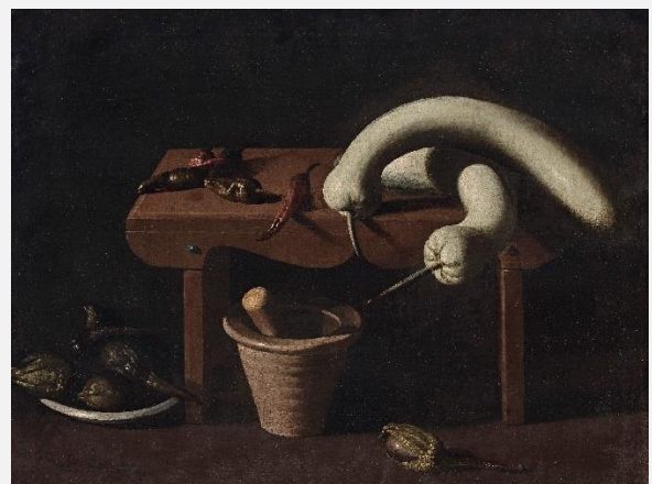
Nicolás Cortés Gallery – Francisco de Zurbarán (Fuente de Cantos, Badajoz 1598-1664 Madrid), Nature morte de Carême , XVIIe siècle

Zurbarán est considéré par les critiques comme un « Caravage espagnol ». Lors de son apprentissage à Séville au début du XVIIe siècle, il se lie d'amitié avec Velasquez. A ses débuts, il peint principalement pour des églises. Dès 1629, il s'installe à Séville définitivement et connaît la célébrité. Démodé presque oublié à la fin de sa vie, il est redécouvert et considéré aujourd'hui comme l'un des plus grands peintres de cette époque.