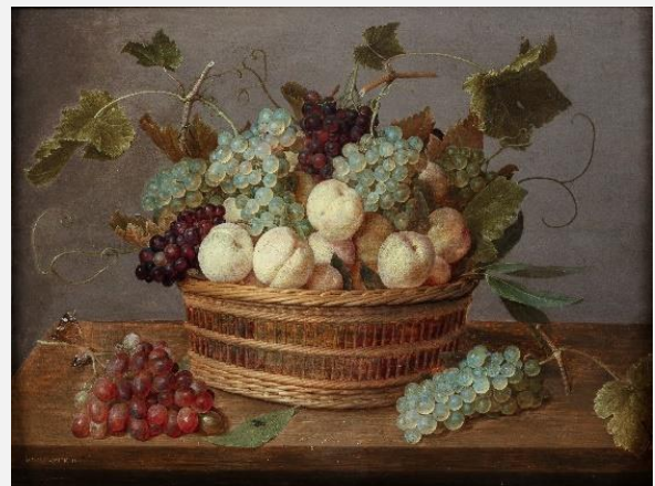
Jacob Van Hulsdonck (Anvers, 1582-1647), Nature morte aux pêches et aux raisins , XVIIe siècle

Cette nature morte de Jacob Van Hulsdonck (1582-1647) est signée JHVHLSDONCK-FE• avec la marque de la guilde des fabricants de panneaux d'Anvers et incisé avec la marque en forme d'étoile à six branches d'un fabricant de panneaux d'Anvers encore non identifié, actif entre 1619-50.