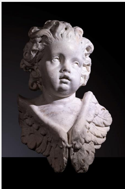
Romigioli Antichità – Giovanni Baratta (Italie, 1670-1747), paire de cherubins, 1699, en marbre de Carrare, H 72 cm