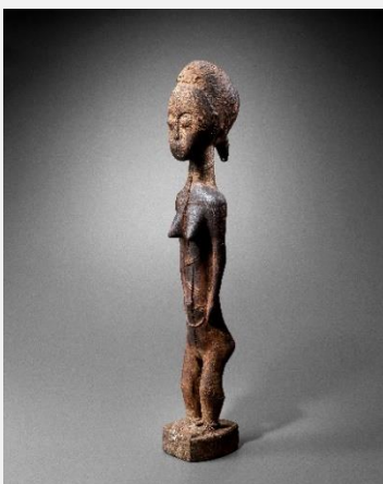
Galerie Montagut – Statuette Baoulé, Peuple Baoulé, Côte d'Ivoire, XIX e siècle, en bois, H 60 cm