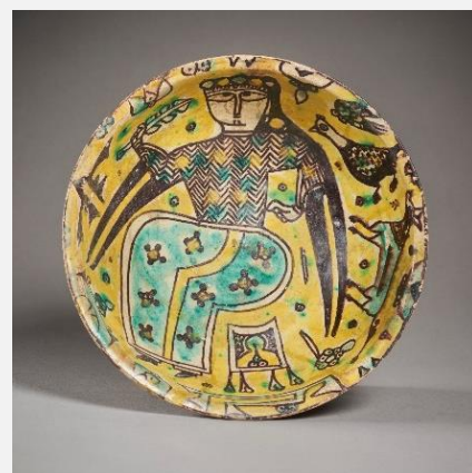
Coupe en terre cuite, Art persan, dynastie samanide, Iran oriental (Khurasan), Nishapur, Xe siècle, terre cuite peinte en noir, jaune et vert sous une glaçure transparente, H 6,2 cm ; Ø 18,2 cm

Cette coupe appartient à une production particulièrement originale de la céramique médiévale iranienne à l'époque de la dynastie samanide (874-1005), presque exclusivement attribuable à la seule ville de Nishapur dans le Khorassan (Est de l'Iran). Elle réunit sur une seule pièce, l'ensemble des motifs qui constituent le répertoire décoratif de ce groupe : représentation humaine, animale, végétale, calligraphie.