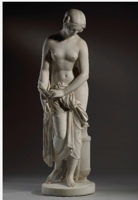
Gallery Desmet – Richard James Wyatt (London, 1795-1850), Nymphe entrant dans le bain , circa 1830, en marbre blanc, H 155 cm