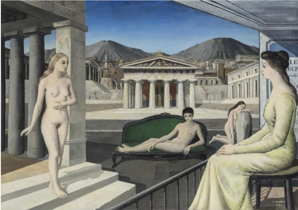
Paul Delvaux (1897-1994), Le Canapé vert, 1944