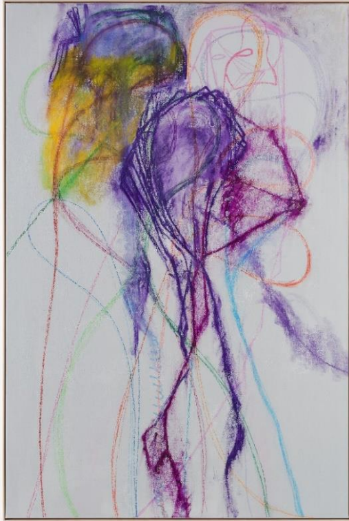
Bernier-Eliades Gallery - Cameron Jamie (USA, 1969) Fuzz's Second Dream, 2023