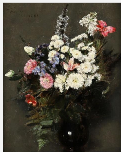
Douwes Fine Art B.V. – Henri Fantin-Latour (Grenoble 1836-1904 Bure), Fleurs d'Automne , 1861

Henri Fantin-Latour (1836-1904) appartient au mouvement du réalisme français. Il s'est lié d'amitié avec des poètes contemporains comme Arthur Rimbaud et Paul Verlaine, et a été influencé par la musique de Wagner et de Berlioz. Outre les portraits, il est largement célébré pour une série de fleurs et de natures mortes délicatement détaillées. Ce bouquet d'automne est un excellent exemple de l'une de ces natures mortes comprenant différentes fleurs. Il témoigne également de l'utilisation brillante des couleurs par Fantin. Peinte en 1861, il s'agit d'une œuvre très précoce d'Henri Fantin-Latour qui n'avait que 25 ans à l'époque.