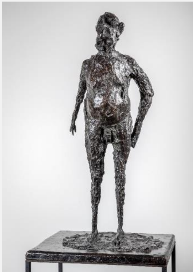
Galerie de la Béraudière – Germaine Richier (Grans 1902-1959 Montpellier), L'Ogre , 1949 en bronze avec patine noire, H 81,2 x L 45 x P 40,3 cm

Cette œuvre est représentative d'une période cruciale dans la carrière de Germaine Richier (1902-1959), celle de l'après-guerre qui fait écho aux interrogations de la société et aux désillusions. Loin du naturalisme de ses débuts, l'humanité figurée prend une autre tournure en révélant désormais une vision tragique de la réalité. Tout le corps de l'Ogre est fait de déchirures. Les surfaces sont rongées, déchiquetées et trouées selon une esthétique qui brouille la frontière entre figuration et défiguration.