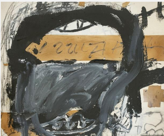
Galerie Jordi Pascual – Antoni Tàpies (Barcelona 1923-2012), Cap amb paper encolat , 1987