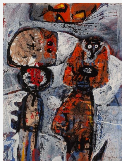
Rueb Modern art – Lucebert (Amsterdam 1924-1994 Alkmaar), Nomadic , 1959

Lucebert (1924-1994), pseudonyme de Lubertus Jacobus Swaanswijk, était un peintre-poète expérimental hollandais qui faisait partie du mouvement CoBrA dans les années 1948-1949. Son œuvre est caractérisée par un style figuratif-expressionniste enfantin et montre souvent une vision pessimiste de l'homme avec des formes sinistres et des visages déformés.