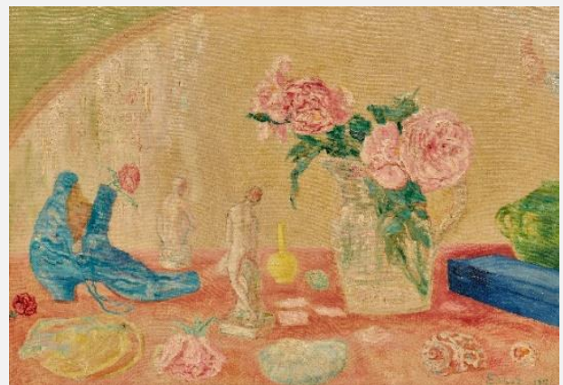
James Ensor (Ostende, 1860-1949), Roses, tanagras et bottes, 1917

Pour la composition de ses natures mortes, James Ensor (1860-1949) utilise souvent des objets de son atelier, notamment les masques vendus dans la boutique de souvenirs de ses parents à Ostende, des coquillages ou des fleurs. Plus exceptionnellement, l'artiste introduit un élément iconographique incongru qui témoigne de son humour. C'est le cas dans ce tableau qui représente une botte bleue déformée, avec un personnage androgyne et une rose.