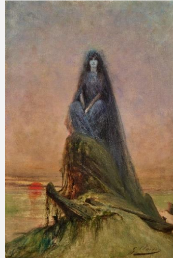
Segoura Fine Art – Georges Jules Victor Clairin (Paris 1843-1919 Clohars-Carnoët), L'Epave , 1904

Cette œuvre de Georges Jules Victor Clairin (1843-1919) a été offerte à la tombola des artistes français de 1904, au profit des blessés de guerre. Elle symbolise la célébration de la force de l'esprit humain qui peut émerger après la tourmente. Dans cette scène, la femme incarne la force intérieure et la sérénité face à l'adversité. Elle est l'essence de la survie, la métaphore vivante de la capacité humaine à affronter les épreuves et à persévérer, même lorsque tout semble perdu. Le rocher sur lequel elle est assise incarne la stabilité et la constance, un point d'ancrage inébranlable dans l'éveil du jour.