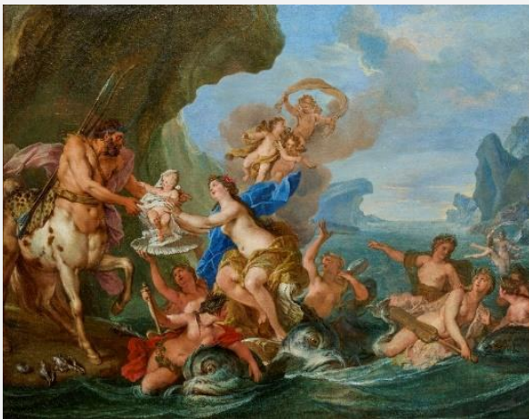
F. Baulme Fine Arts – Nicolas Bertin (Paris, 1668-1736), Achille confié par Thétis au centaure Chiron , circa 1725

Nicolas Bertin (1668-1736) fait partie de cette génération charnière des peintres dits « du Trianon », qui débutèrent leur carrière sous le