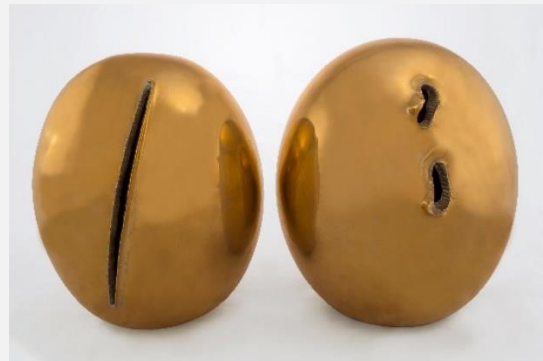
Lucio Fontana (Argentine, Rosario 1899-1969 Comabbio, Italie), Concetto Spaziale Natura, 1967, en laiton poli, H 26 x L 20 x P 21 cm

Cette œuvre de Fontana (1899-1969) composée de deux éléments est enregistrée à la Fondazione Lucio Fontana. Le numéro gravé (édition) est 186/500 sur les deux sculptures. Le certificat d'authenticité original de l'Atelier Lucio Fontana date de 1967. Ce qui rend cette œuvre remarquable, c'est la patine absolument particulière du laiton.