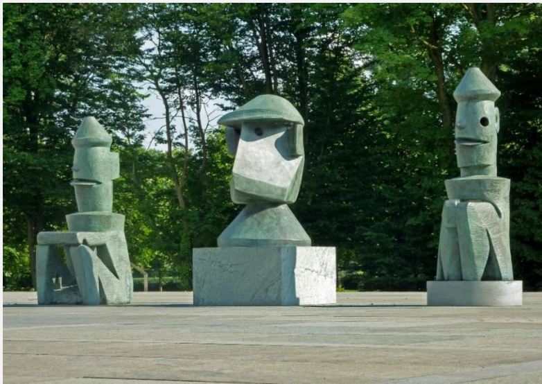
DIE GALERIE, Max Ernst (Brühl 1891-1976 Paris), Corps enseignant pour une école de tueurs , 1967/2020, en bronze, ex. 8/8

En 1967, Max Ernst (1891-1976) réalise un ensemble de sculptures en pierre intitulé Corps enseignant pour une école de tueurs . Le groupe se compose de trois figures indépendantes de 2 m de haut : Séraphin le néophyte, Big Brother et Séraphine-Cherubin, dite Big Sister. Le titre moqueur et le mimétisme impertinent des personnages font du groupe une sorte d'anti-monument, dans la droite ligne de l'esprit critique et anarchique de Max Ernst et du dadaïsme. La figure de Big Brother, inspirée du roman "1984" de George Orwell, incarne le totalitarisme et la surveillance fasciste. À droite et à gauche de Big Brother, Max Ernst a placé Séraphine-Cherubin et Séraphin le néophyte, deux anges de lumière qui, à l'origine, descendent directement de Dieu. D'un air moqueur, ils tirent la langue. Ils peuvent être interprétés comme des personnifications d'une autorité ecclésiastique que Max Ernst rejetait avec véhémence. L'artiste avait prévu de réaliser une version de ce groupe en bronze. Celui-ci a été coulé dans la célèbre fonderie française Susse.