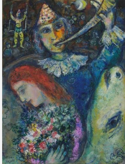
HELENE BAILLY – Marc Chagall (Vitebsk 1887-1985 Saint-Paul de Vence), Au cirque ou Clown à la trompette , 1959-1968

Construite autour de quatre figures, cette œuvre est emplies de symboles se référant à la vie personnelle de Chagall (1887-1985). Ici, l'artiste évoque son couple et son mariage en se représentant lui-même sous les traits du cheval et en peignant sa femme Bella. Au centre, le clown, rappelant les musiciens de son village natal de Vitebsk, célèbre l'union. Fasciné par le cirque depuis son enfance, Chagall mêle dans ce tableau ses sujets de prédilection.