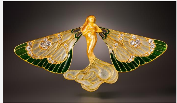
Epoque Fine Jewels – René Lalique (Ay 1860-1945 Paris), broche-pendentif Art nouveau, en émail, diamants roses et or 18 carats

René Lalique (1860-1945), artiste, bijoutier et verrier français de renom, fut l'une des figures les plus influentes des mouvements Art nouveau et Art déco à la fin du XIXe siècle et au début du XXe siècle. L'élément central de cette broche, la nymphe est caractéristique de l'œuvre de Lalique. La nymphe est souvent représentée comme une figure féminine sensuelle et mythique avec des cheveux flottants et des courbes gracieuses, représentant le lien entre la nature et la beauté humaine.