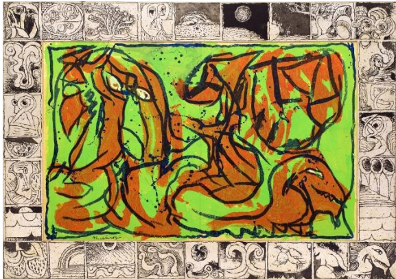
Samuel Vanhoegaerden : Pierre Alechinsky (Bruxelles, 1927), L'or du rien , 1967-1968. Acrylique sur papier marouflé sur toile, avec une prédelle à l'encre de Chine, 210 x 295 cm

En art belge, le stand (110) de Samuel Vanhoegaerden Gallery (BE) sera entièrement consacré à l'un des artistes majeurs du mouvement CoBrA, Pierre Alechinsky. Environ 30 œuvres seront réunies, datant des années 60 à aujourd'hui. La pièce maîtresse du stand, et l'une des œuvres les plus importantes de Pierre Alechinsky, est "L'or du rien", qui a été présentée pour la première fois à la 36e Biennale de Venise en 1972. C'est la première fois en 25 ans qu'un panorama de cette taille et de cette importance est présenté dans une galerie.