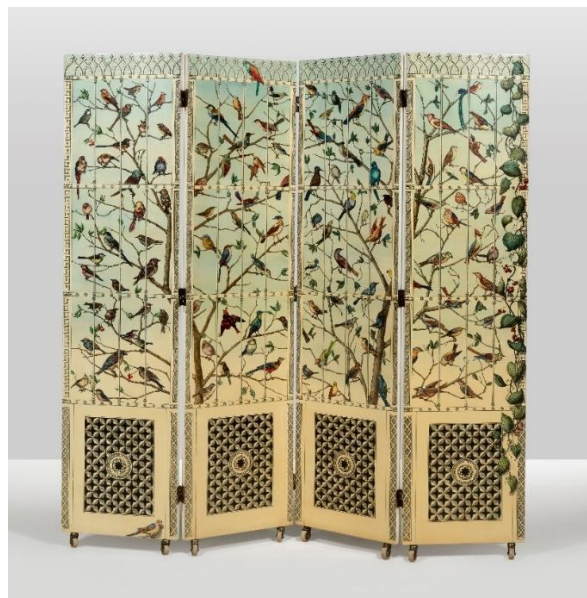
Gokelaere & Robinson : Piero Fornasetti (Italie, 1913-1988), Paravent "Uccelli", 1953. Bois peint à la main, laiton H 207 x L 200 x P 3 cm