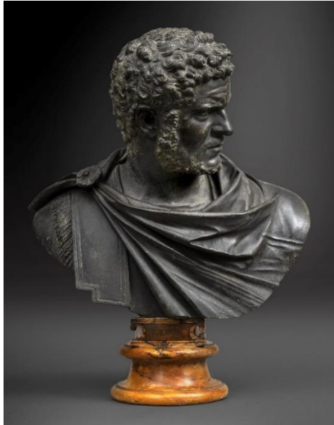
Desmet Gallery : (Att) Luigi Valadier (1726 – 1785), L'Empereur Caracalla, Rome, dernier quart du XVIIIe siècle. Bronze, patine verdâtre foncée sur une base en marbre Giallo di Siena, H 68 cm

En sculpture classique, la Desmet Gallery (BE) située sur le stand 31, exposera un très beau buste de Luigi Valadier dont le travail du bronze est exceptionnel. Descendant d'une dynastie d'orfèvres, c'était un sculpteur très apprécié des familles influentes à Rome. Le Pape Pie VI faisait partie de ses clients ainsi que l'Archiduc Ferdinand d'Autriche. Il a également reçu des commandes d'églises du monde entier.