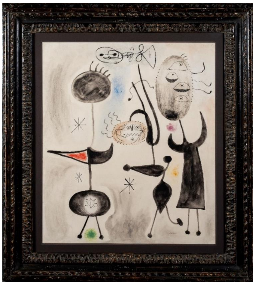
Simon Studer Art SA : Joan Miró (1893-1983), Petites filles intriguées par le vol d'un oiseau sautant à la corde , 1942,