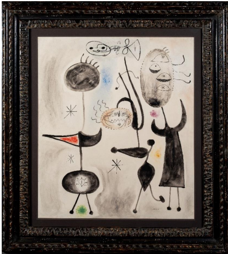
Simon Studer Art SA: Joan Miró (1893-1983), Jonge meisjes geïntrigeerd door de vlucht van een vogel , 1942