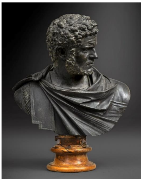
Desmet Gallery: (Att) Luigi Valadier (1726 – 1785), Keizer Caracalla, Rome, laatste kwart van de 18e eeuw. Brons, donker groenachtig patina op een marmeren basis Giallo di Siena, H 68 cm

Desmet Gallery (BE), die zich op stand 31 bevindt, stelt een heel mooie buste van de hand van Luigi Valadier tentoon waarvan het bronzen werk exceptioneel is. Als telg van een dynastie van goudsmiden was dit een beeldhouwer die erg gewaardeerd werd door invloedrijke Romeinse families. Paus Pius VI mocht hij onder zijn klanten tellen, alsook Aartshertog Ferdinand van Oostenrijk. Hij ontving eveneens bestellingen van kerken wereldwijd.