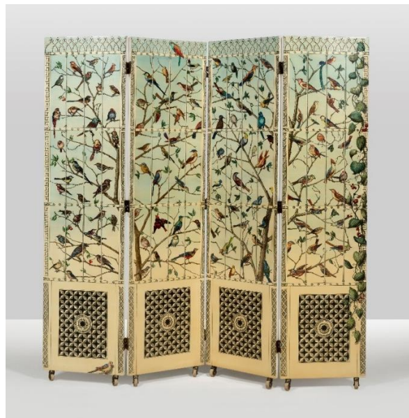
Gokelaere & Robinson: Piero Fornasetti (Italië, 1913-1988), 'Uccelli'-paravent, 1953. Met de hand geschilderd hout, messing H 207 x L 200 x D 3 cm

Andere galerijen die op BRAFA aanwezig zullen zijn, stellen kunstwerken van Pierre Alechinsky ten toon: Harold t'Kint de Roodenbeke (BE), stand 32, met 10 werken uit de periode 1950-1970, maar ook DIE GALERIE (DE), stand 78, Maurice Verbaet Gallery (BE), stand 13, Galerie Boulakia (UK), stand 47, Galerie Jamar (BE), stand 91, Galerie Seghers (BE), stand 121, Rodolphe Janssen (BE), stand 36 en Galleries AB-BA (FR), stand 73.