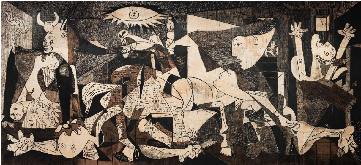
Nosbaum Redding: Damien Deroubaix,(Rijsel, 1972), Garage days re-re-visited , 2019. Gegraveerd hout en inkt 243 x 776 x 1 cm. Uniek stuk

Een must-see op BRAFA: stand 76 van de galerie Morentz (NL) met aan weerszijden een rode wenteltrap van Georges Ferran, gemaakt voor Axe, in polyesterschuim, staal en lak, Frankrijk, 1971.