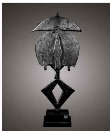
Dalton Somaré: titulaire figuur, Mbulu-Ngulu Kota Obamba, Gabon, 19e eeuw. Hout, koper, messing H 57 cm

Onder de tentoongestelde tribale kunstwerken biedt Dalton Somaré (IT) een opmerkelijk beeldje te koop aan op stand 7. Deze Milanese galerie toont een perfecte geometrische sculptuur. Het betreft een vroegtijdig en klassiek voorbeeld van een bewakersfiguur Kota, die zich onderscheidt van het corpus van de Obamba-relikschrijnen door de precieze vervaardigingswijze. Het gelaat vormt een scherpe ellips doorkruist door twee brede messingplaatjes die de figuur een ernstige en dromerige expressie verlenen. Naast zijn onberispelijke stamboom kan dit beeldje beschouwd worden als een van de meest expressieve en zuivere voorbeelden binnen deze stijl.