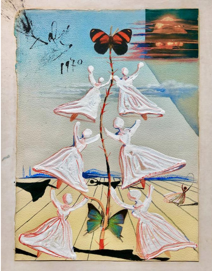
Salvador Dalí, Campanas de azúcar . Galería Jordi Pascual