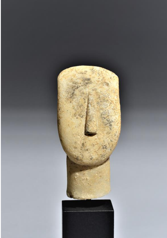
Cabeza cicládica. Günther Puhze

En arte antiguo, Hioco destaca Maitreya sentado , una escultura de esquisto de la antigua región de Gandhara (ca. III-IV), en India, en la que se percibe la influencia del arte griego en las representaciones de Buda por las conquistas de Alejandro Magno en la India. Es una pieza muy fina y bien conservada (240.000 euros). Günter Puhze presenta una Cabeza cicládica (ca. 2800-2300 aC) de mármol; mide solamente 10,5 cm, pero es una maravilla y facilita la comprensión de la escultura de las vanguardias históricas. La galería Serge Schoffel ha vendido toda su colección de rombos del Golfo de Papúa a un solo coleccionista por más de 50.000 euros. Didier Claes presenta una espectacular figura Nkisi Songye de la República del Congo, en madera, un personaje tocado con un cuerno en la cabeza para colgar objetos mágicos y reafirmar su poder. También hay en su stand cucharas de marfil (a partir de 3.000 euros).