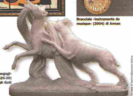
«Coppia di segugi» (1825-30) di Joseph Gott