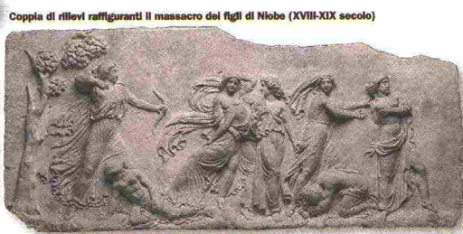
Coppia di rilievi raffiguranti il massacro dei figli di Niobe (XVIII-XIX secolo)