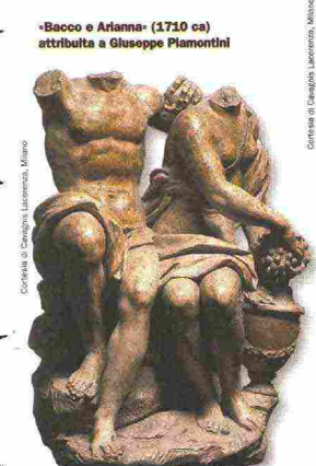
«Bacco e Arianna» (1710 ca) attribuita a Giuseppe Piamontini