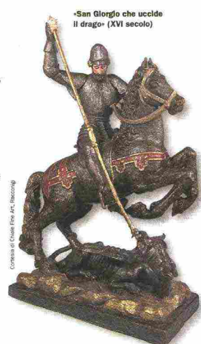
«San Giorgio che uccide il drago» (XVI secolo)