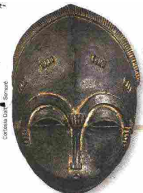
Maschera Baule, Costa d'Avorio, XIX secolo