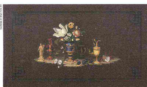
Piano di tavolo in porfido egiziano (1890) di Giovanni Ugolini