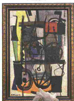
«Granello d'inverno» (1952) di Giuseppe Santomaso