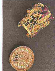
Bracciale «Instrumente de musique» (2004) di Aman