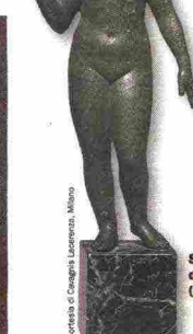
Statua di Afrodite (II secolo a.C.)