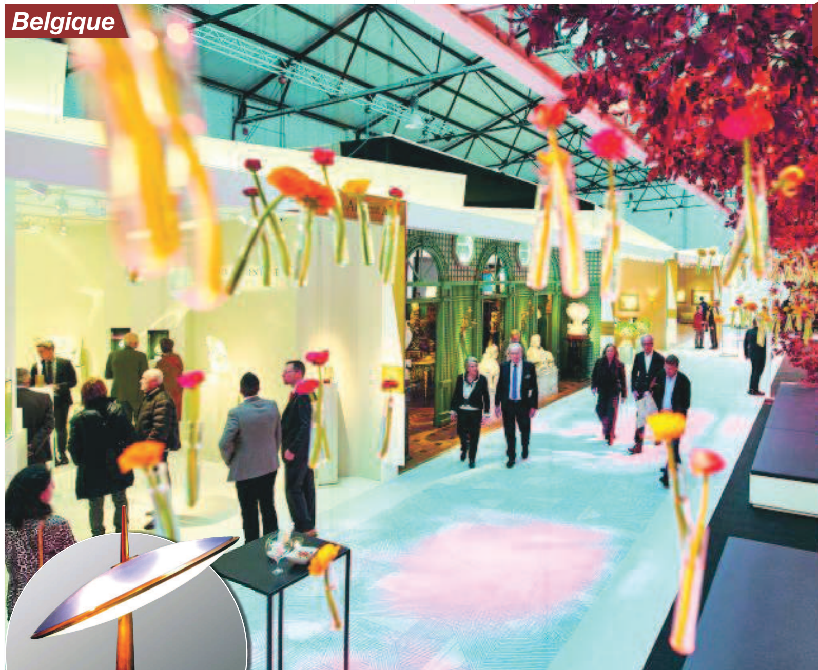
La BRAFA, un lieu pour les amoureux de l'art sous toutes ses coutures. FABRICE DEBATTY

La Grand-Place, incontestablement le plus bel endroit de la ville et quelques musées comme le Musée Magritte, la Fondation Jacques Brel ou encore le musée de la Bande dessinée... eh oui, Bruxelles et Tintin, entre autres, ne font qu'un!