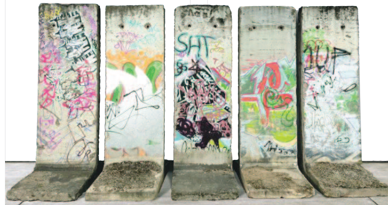
Les cinq segments du Mur de Berlin proposés lors de la BRAFA 2020.

Une vente caritative de cinq segments du Mur de Berlin sera organisée lors de la 65 e édition de la BRAFA (du 26 janvier au 2 février 2020). Ces cinq segments seront exposés et vendus au profit (intégral) de cinq associations et musée actifs dans les domaines de la recherche contre le cancer, de l'intégration des personnes handicapées, et de la préservation du patrimoine artistique. Ils ont été spécialement acquis en 2018, en anticipation du trentième anniversaire de la chute du Mur célébré ce 9 novembre 2019. D'une hauteur de 3,8 m et d'une largeur de 1,2 m pour un poids de 3,6 t chacun, ils sont porteurs de graffitis sur les deux faces, ajoutés par des graffeurs anonymes à différentes époques. Ils seront exposés dans le hall central de la foire et proposés selon une formule d'enchères qui sera réservée aux visiteurs de la BRAFA durant toute sa durée.