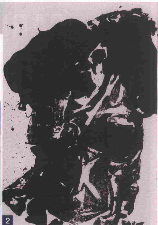
1 Manolo Valdés, Matisse como pretexto en azules , 2018 (galleria Opera). 2 Jannis Kounellis, Senza titolo , 2009 (Bernier/Eliades).

ruani Mercier, Pistoletto da Repetto, il gruppo Zero da Cortesi. Tra le iniziative speciali, un'asta benefica che mette in vendita frammenti del Muro di Berlino.