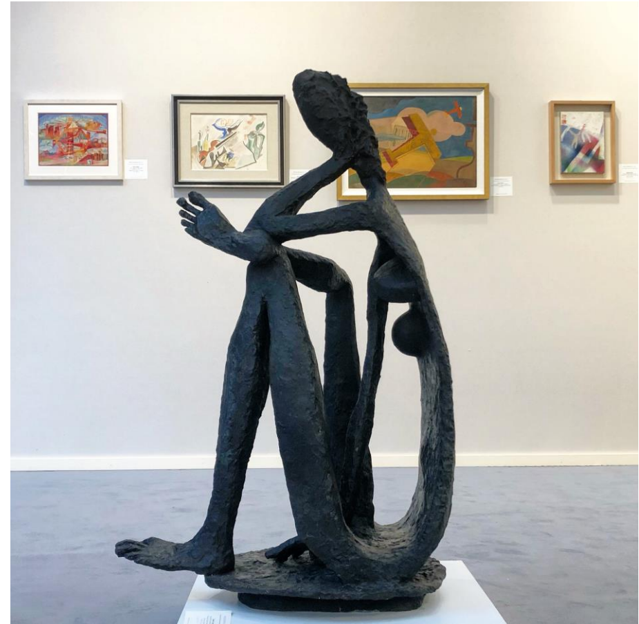
Rosenberg & Co, BRAFA 2020

Individuel: 25 € | < 26 ans: 10 € | < 16 ans: gratuit