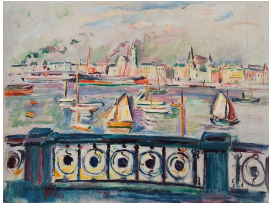
Emile-Othon Friesz (1879-1949), Le port d'Anvers, 1906

Durant l'été 1906, Georges Braque et Emile-Othon Friesz décident de partir en vacances pour la Belgique et c'est lors de ce voyage que s'affirment chez eux les principes expressifs qui caractérisent le fauvisme. Ils séjournent alors à Anvers sur les bords de l'Escaut, à l'entrée du port et s'intéressent exclusivement aux vues maritimes en orientant leurs recherches artistiques sur l'émancipation de la couleur. Empli d'une lumière vive, ce tableau se caractérise par une touche libre et une explosion de couleurs pures. Emile-Othon Friesz offre, ici, une vue inédite du port d'Anvers observé depuis la terrasse de l'ancien casino « Le Kursaal ».