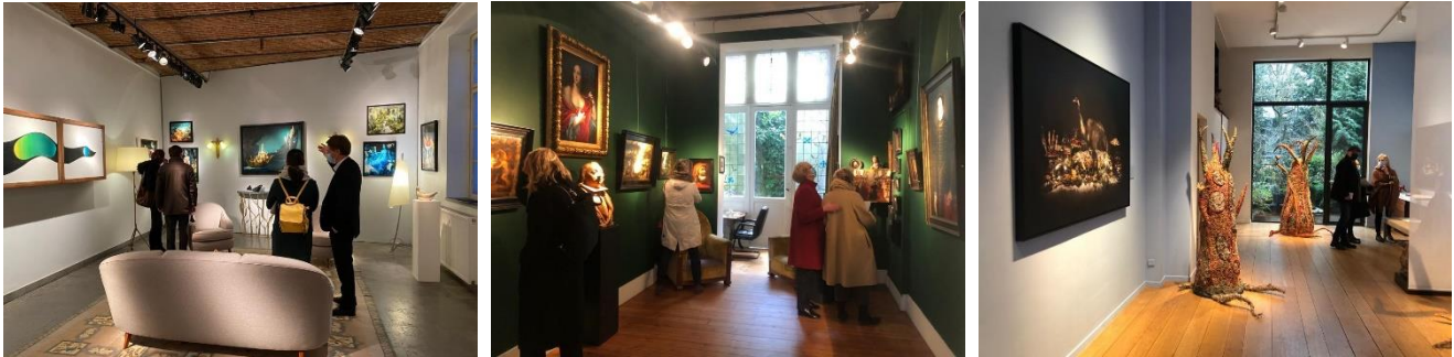
Galerie Ary Jan en Galerie Mathivet bij Costermans & Pelgrims de Bigard (1) – Klaas Muller (2) – Deletaille Gallery (3)

Werk van de Londense galerie Finch & Co , gespecialiseerd in antiques, etnografie, natuurgeschiedenis en kunstvoorwerpen, was te bewonderen bij Gallery Desmet in de Zavelwijk, en de Barcelonese handelaar Montagut Gallery , gespecialiseerd in tribale kunst, stelde tentoon bij galerist didier Claes , op een steenworp van de Louizalaan.