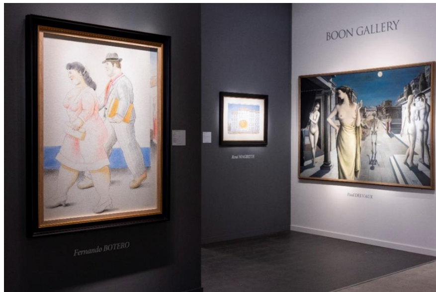
BRAFA 2024 – Stand Boon Gallery

dertigtal werken te ontdekken waarop de terugkerende thema's die de grootmeester na aan het hart lagen, mooi naar voren komen: de vrouw, stations en treinen, taferelen uit de antieke oudheid en de aanwezigheid van skeletten. Zo toont Boon Gallery (Knokke-Stand 26) een schilderij getiteld La ville lunaire , dat dateert uit 1944 (en in een geheel ander register, een werk van de Koreaanse kunstenaar Lee Ufan alsook een schitterende Jean Dubuffet, niet te missen op de Beurs) en Francis Maere Fine Arts (Gent-Stand 40) biedt het werk L'été aan, geschilderd in 1963. Galerie Taménaga (Parijs-Stand 87) brengt La tente rouge mee uit 1966 en bij Opera Gallery (Genève-Stand 107) is er een werk te zien uit 1968, getiteld La fin du voyage .