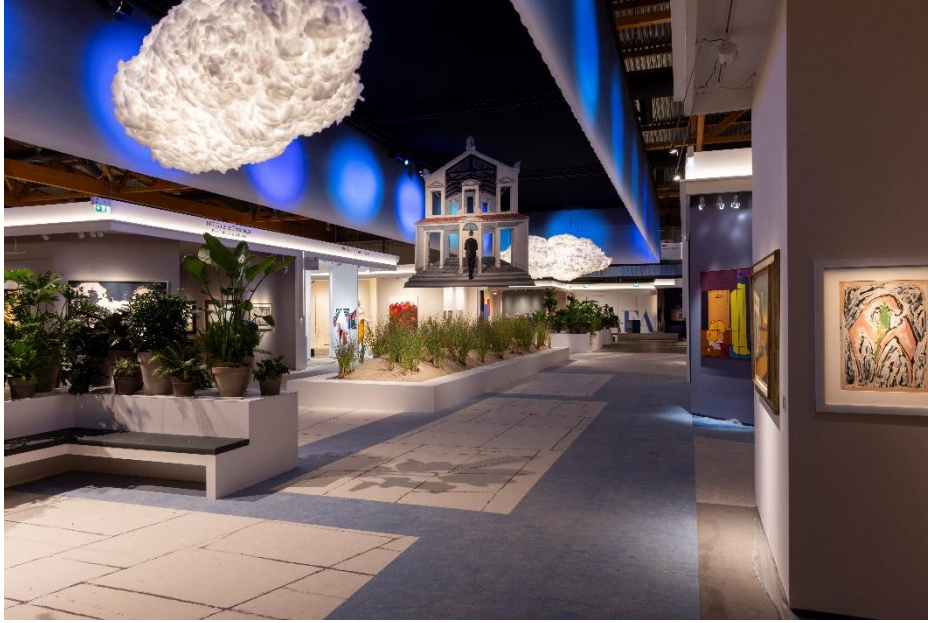
BRAFA 2024 – General View

BRAFA 2024 was opnieuw een succes, met een recordaantal bezoekers. Bijna 67.000 kunstliefhebbers van alle leeftijden zakten de voorbije acht dagen af naar Brussels Expo om de 132 deelnemende galeries te ontdekken. Als eerste beurs van dit kunstjaar werd BRAFA unaniem geprezen door de bezoekers, zowel voor de kwaliteit van de getoonde objecten als voor de magie van het surrealistische decor dat de Beurs vormgaf.