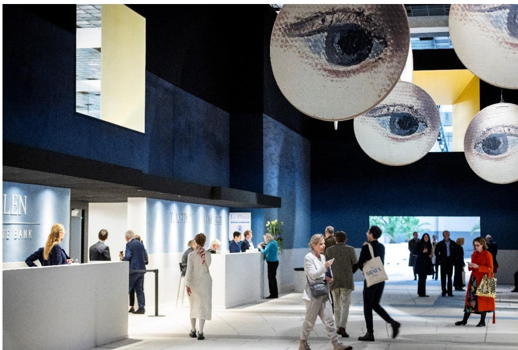
BRAFA 2024 – General View