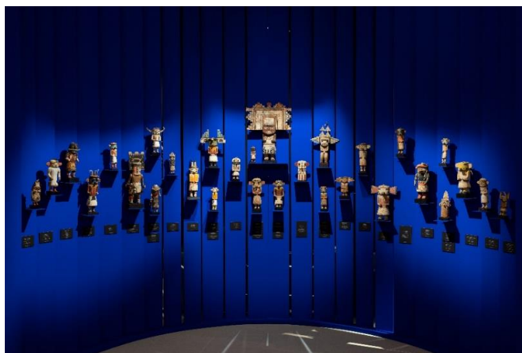
BRAFA 2024 – Galerie Flak

Montagut Gallery (Barcelona) , gespecialiseerd in tribale kunst, heeft een houten sculptuur van het Jörai- volk uit het hoogland van Tay Nguyen, Vietman, verkocht, daterend uit de 18e eeuw. Bij Claes Gallery (Brussel) liet een koper zijn oog vallen op het Yaure-masker, Ivoorkust, eind 19e, vroeg 20e eeuw. Dit masker, verkocht voor ongeveer 150.000 euro, stond opgesteld op een 'hangende' bibliotheek uit 1946 in hout, gebogen plaatstaal en aluminium van Jean Prouvé (Parijs 1901-1984 Nancy), die zelf ook gekocht is door een verzamelaar voor een bedrag rond 500.000 euro. Galerie Flak (Parijs) heeft een groot deel verkocht van de werkjes uit zijn thema-expo van 'kachina'-poppen, (Hopi-cultuur, Arizona) daterend uit 1880 tot 1930, waarvan de prijzen variëren tussen 5.000 en meer dan 50.000 euro voor elk van die beeldjes.