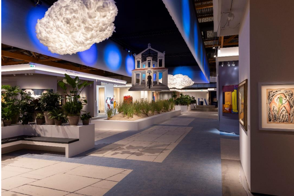
BRAFA 2024 – General View

Nouvelle réussite et affluence record pour cette édition 2024 de la BRAFA. Près de 67.000 amateurs d'art, de différentes générations, se sont pressés durant ces 8 jours pour découvrir les 132 galeries présentes à Brussels Expo. Première foire du calendrier de l'année artistique, la BRAFA a fait l'unanimité auprès de ses visiteurs tant par la qualité des objets exposés que par la magie du décor surréaliste qui dessinait la Foire.