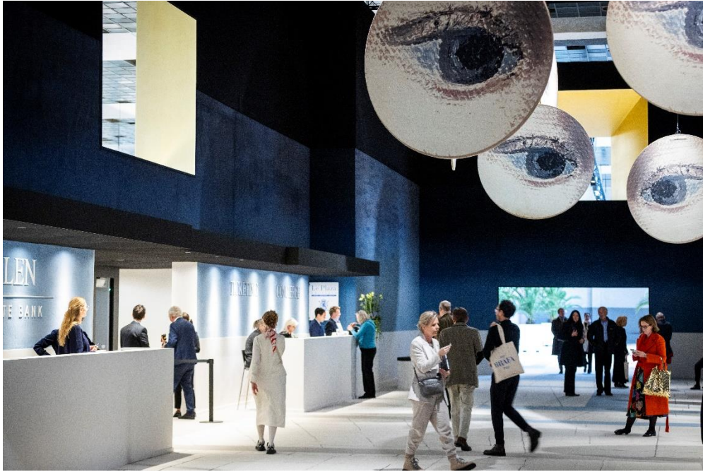
BRAFA 2024 – General View