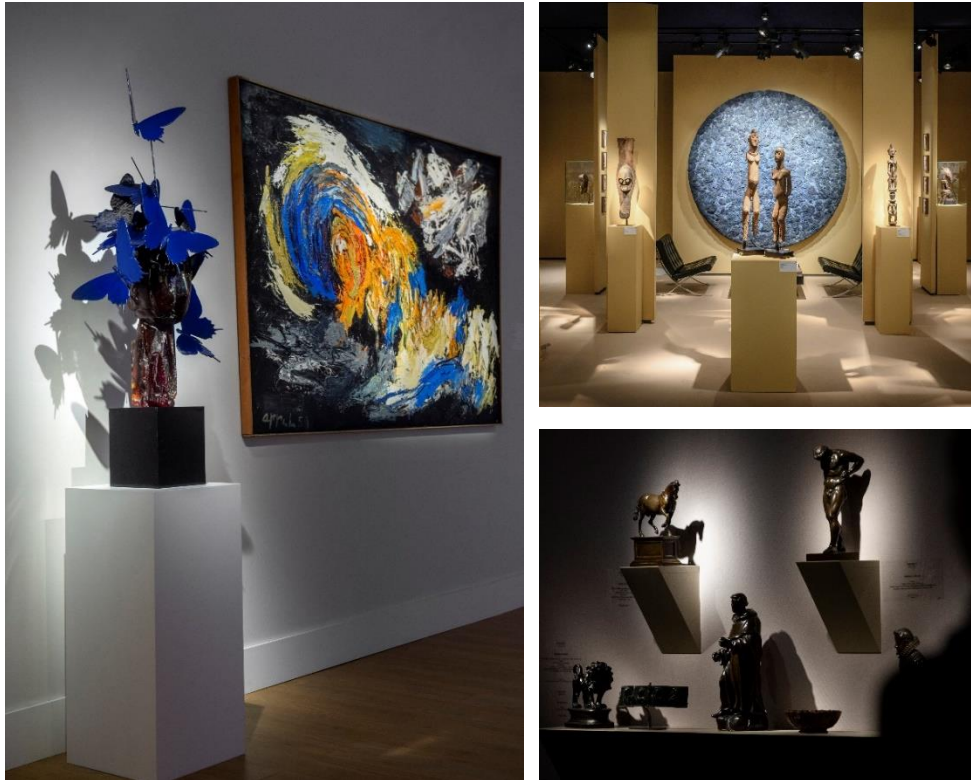
(1) BRAFA 2023 - Opera Gallery (2) BRAFA 2023 - Montagut Gallery (3) BRAFA 2023 – Gallery Desmet