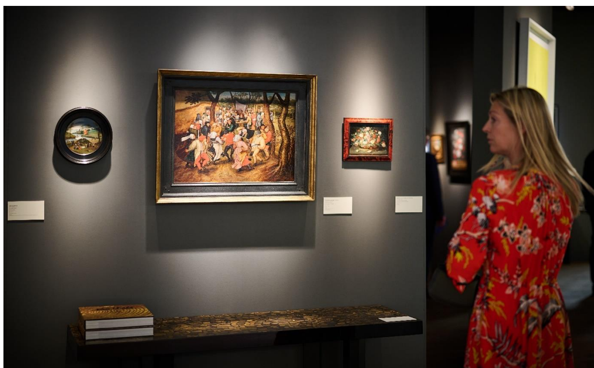
BRAFA Art Fair 2022 - De Jonckheere

BRAFA 2023: torna a Gennaio la 68.edizione e apre il calendario internazionale dell'arte