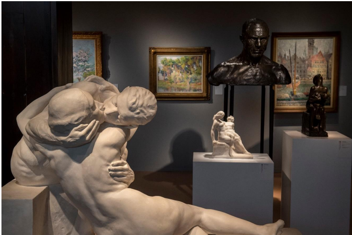
BRAFA Art Fair 2022 - Francis Maere Fine Arts