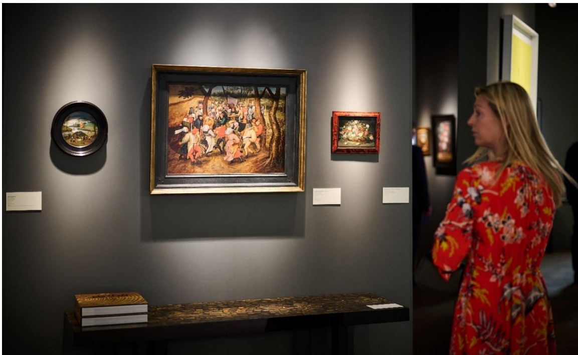
BRAFA Art Fair 2022 - De Jonckheere

BRAFA 2023 : La BRAFA retrouve ses dates de janvier dans le calendrier des foires d'art internationales