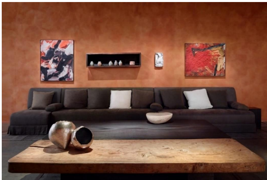
BRAFA 2022 - Axel Vervoordt