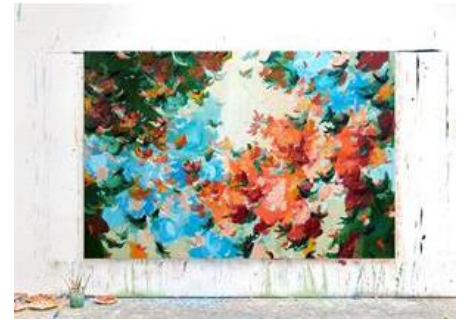
Arne Quinze, Erysimum – Zinnia_Luminosa @ Maruani Mercier