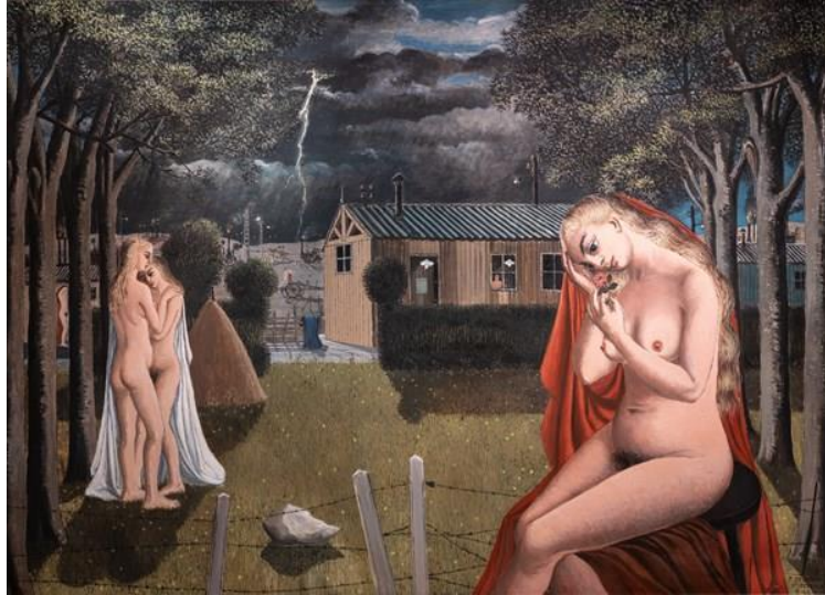
Paul Delvaux, The Storm , 1962 @ De Jonckheere

La Brafa se distingue par sa diversité et sa particularité de « cross-collecting », grâce à un parfait mélange des styles et des époques. 20 spécialités sont couvertes, de l'archéologie à l'art contemporain et au design. 10.000 à 15.000 objets sont mis en vente lors de chaque édition de la foire.