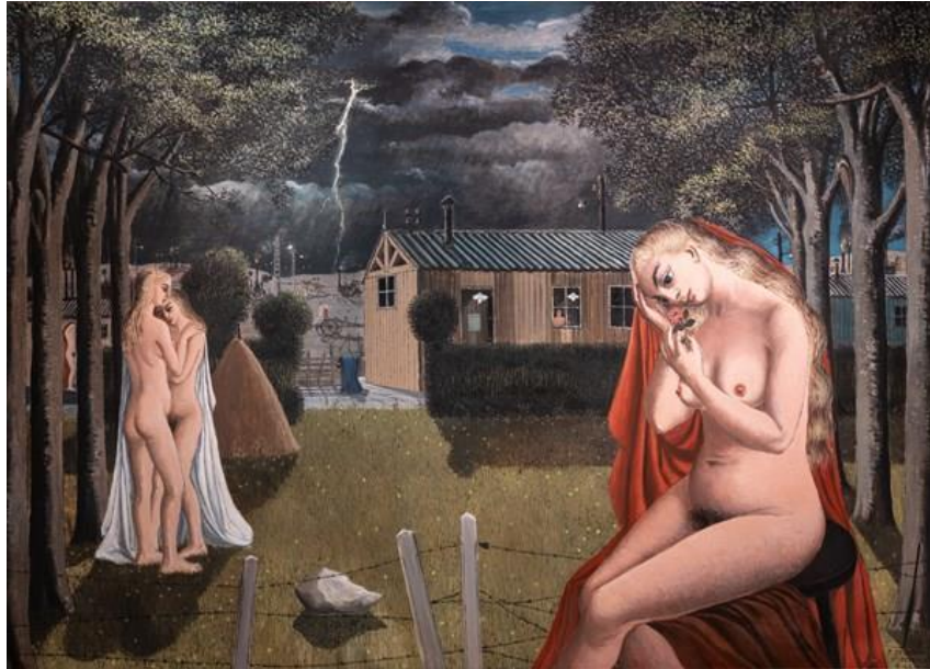
Paul Delvaux, The Storm, 1962

Onder de dit jaar te ontdekken hoogtepunten, een fragment van het hoofd van de farao Senusret I bij Axel Vervoordt , een Paul Delvaux van 1962, The Storm , bij De Jonckheere . Studio 2000 Art Gallery toont Children making music , een schilderij van Jan Sluijters uit het begin van de 20e eeuw (circa 1918) en L'Univers du Bronze , een beeld van Auguste Rodin, Age d'Airain , 1875-1877. Eindelijk, Hélène Bailly Gallery brengt een naakte vrouwenbuste mee van Kees Van Dongen, Fernande Olivier , 1911.