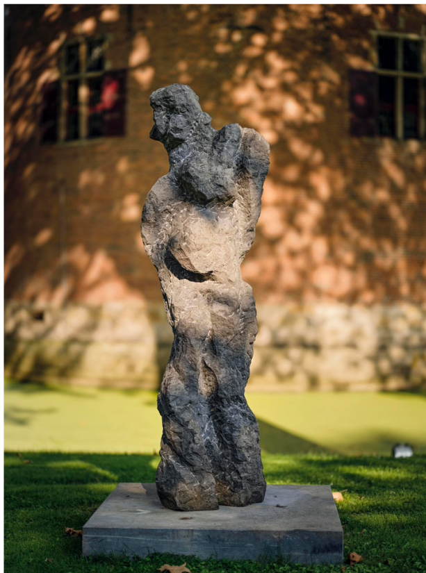
Эжен Додень. Скульптура из голубого бельгийского камня. 1966 г. Мастерская Eugene Dodeigne — галерея Francis Maere Fine Arts.