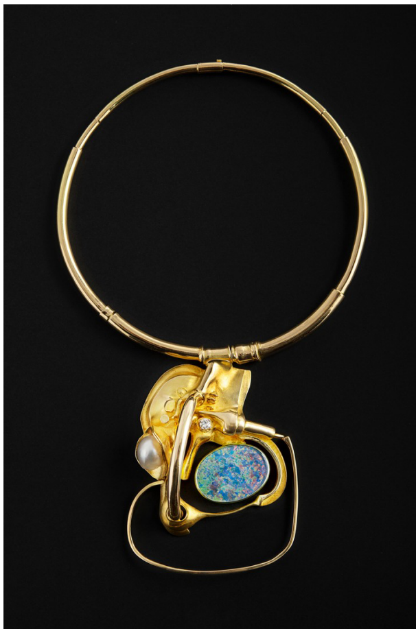
Колье, диз. Клода Везеля для Fernand Demaret Studio. 18-каратное золото с крупным дублетом опала, бриллиантами и жемчугом. Collectors Gallery.