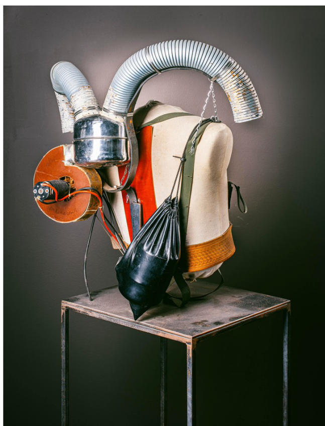
Панамаренко (Хенри ван Хервеген), Rugzakvlucht 4KW, 1984. Летная экипировка на тканевом манекене. Смешанная техника. Galerie Jamar.