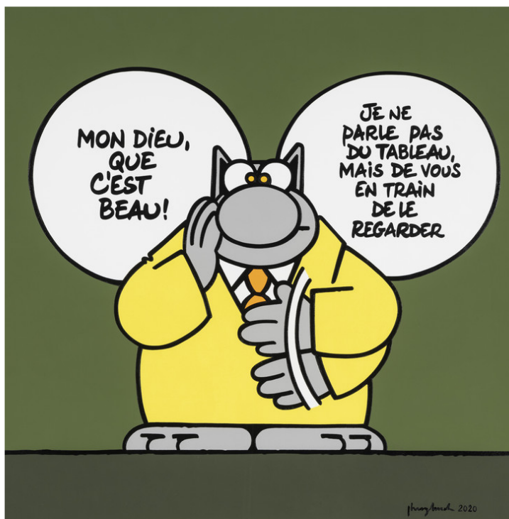
Филипп Гелюк, «Какая красота», 2020. Акрил на холсте. Huberty & Breyne.