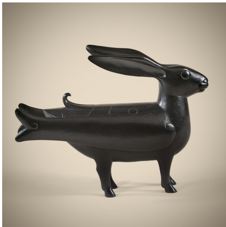
Франсуа Ксавье Лаланн, Lapin polymorphe (Полиморфный кролик), 1968/1988 гг. Бронза. Galerie Mathivet.