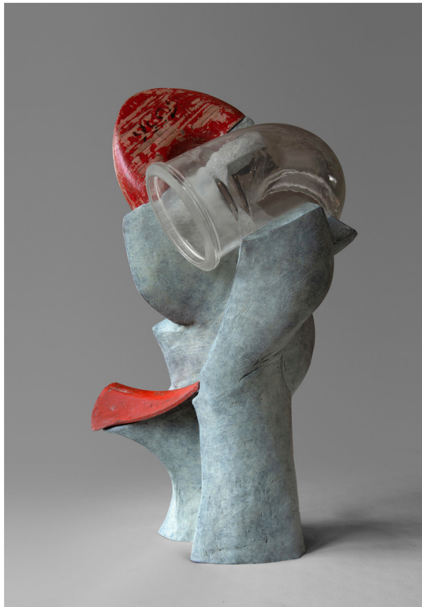
Катрин Франсуа, скульптура Tube en verre, 2021. Бронза, стекло и дерево. Единственный экземпляр. Галерея La Forest Divonne.