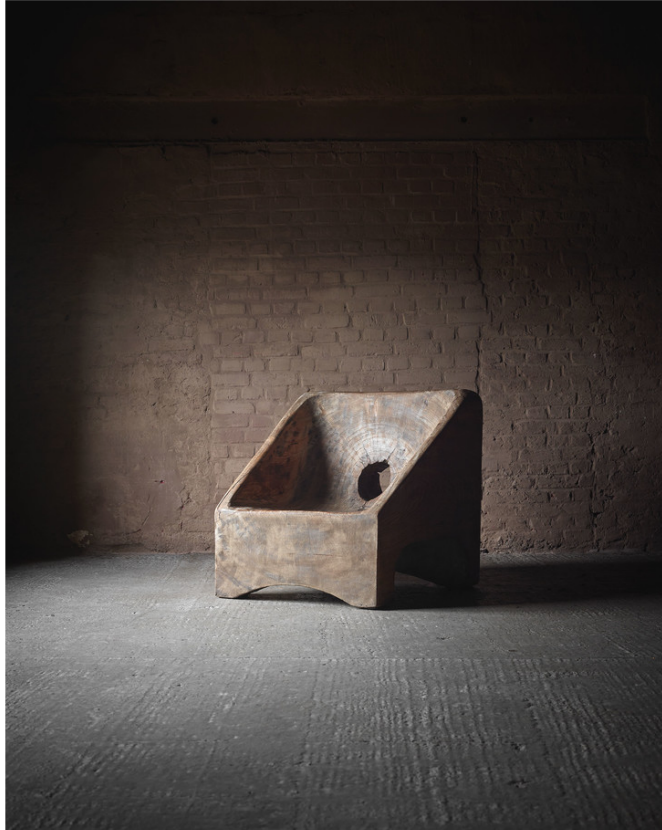
Кресло из древесины пекиб, диз. Хосе Занин Калдас, Бразилия, около 1970г. Галерея Axel Vervoordt.