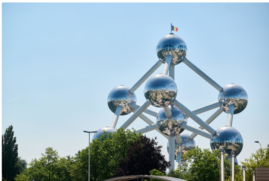
Вид на Атомиум, Брюссель