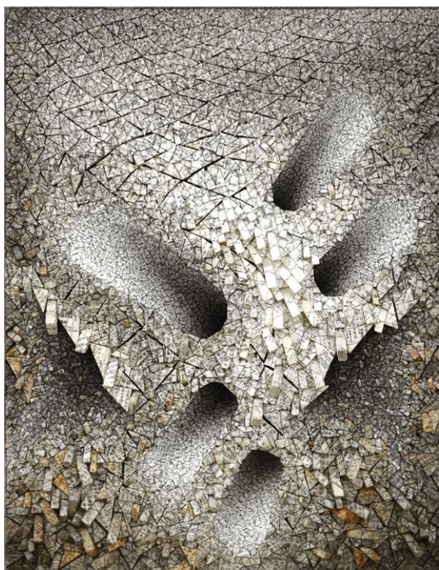
Чан Кван Йонг. Aggregation. 2007 г. Смешанная техника, корейской шелковая бумага. Boon Gallery.