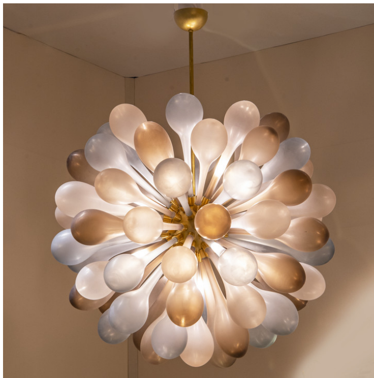
Светильник, диз. Симона Сенедесе. Муранское стекло, латунь. Галерея Maison Rapin.