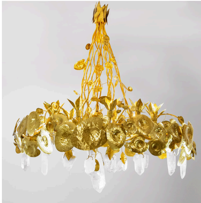
WATERLILY CHANDELIER, 1973 128 X 110 CM

Робер Гуссенс – французский ювелир «с душой художника и рукой мастера». Каждое его творение – на стыке искусства и ювелирного дела. С конца 1950-х годов Дом Goossens расширил производство и, кроме ювелирных изделий и аксессуаров, стал выпускать «украшения для пространства» – люстры, зеркала и другие предметы декора.