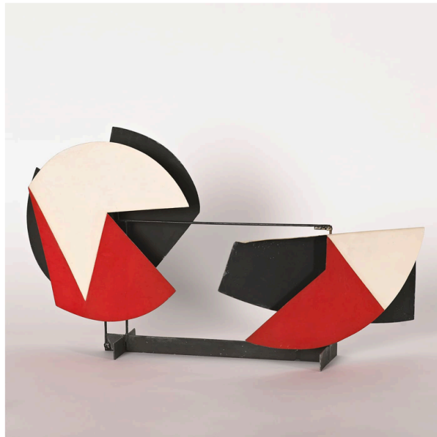
PLAN MOBILES, 1953 КРАШЕННЫЙ МЕТАЛ 30 X 57 X 15 CM

Поль Бюри – бельгийский художник и скульптор. В начале своей карьеры он тяготел к сюрреализму, присоединился к группе единомышленников, а ранние картины Бюри были представлены на Международной выставке сюрреализма в 1945 году в Брюсселе. Однако фокус художника сместился в 1952 году, когда он впервые посетил выставку Александра Колдера. Мобили настолько вдохновили Бюри, что он начал создавать скульптуры с электродвигателями, которые приводили в движение элементы, заставляя их вращаться или наклоняться.