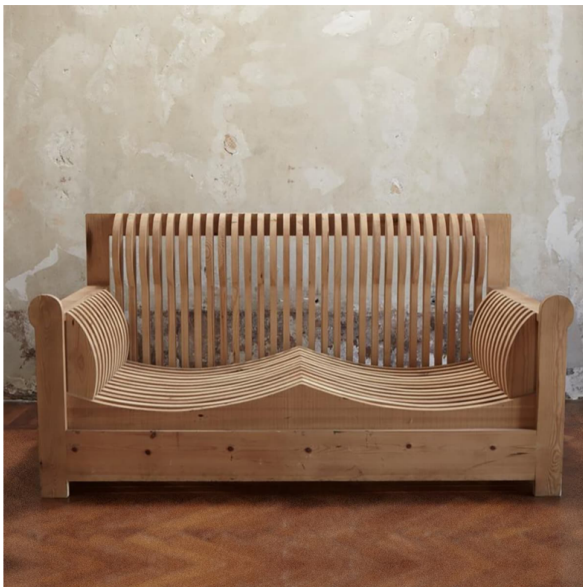
MOBILI NELLA VALLE SOFA, 1966 РУССКАЯ СОСНА 80X154X69 CM ПРОИЗВОДСТВО POLTRONOVA

Для итальянского скульптора Марио Чероли эксперименты с материалами – основа его исследований и творческого роста. Необработанная древесина, доски, сохраняющие неровности, грубые на вид и на ощупь, – любимые материалы творца.