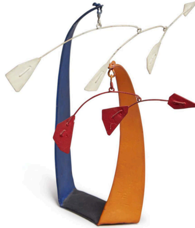
MOBILE, 1946 МЕТАЛЛИЧЕСКИЙ ЛИСТ, ПРОВОЛОКА И КРАСКА 16,5 X 22,9 X 16,5 CM

Александр Колдер, выросший в семье художников (отец скульптор, мать художница), уже с детства создавал свои первые скульптуры. На Рождество 1909 года 11-летний Колдер подарил своим родителям крошечную собачку из гнутого медного листа и кинетическую утку – она раскачивалась при нажатии. Однако, повзрослев, Александр не собирался быть художником и окончил Технологический институт Стивенса со степенью инженера. Лишь спустя время тяга к искусству победила, а полученное техническое образование позволило воплощать самые оригинальные идеи. Например, мобили – скульптуры, движущиеся от потоков воздуха. Среди арт-объектов Колдера есть анимированные версии картин его друга Жоана Миро, с их тонким балансом форм, линий и цвета.