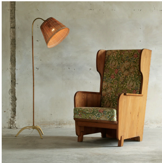
WINGBACK CHAIR "LOVO", 1932 МАССИВ СОСНЫ, ТКАНЬ 112,5 X 69,5 X 80 CM

Шведского архитектора и мебельного дизайнера Акселя Эйнара Хьорта вдохновлял стиль ар-деко. Он часто использовал драгоценные породы древесины, например, палисандр, для изготовления мебели. Дизайн Хьорта характеризуется простыми и несколько грубыми формами. Создавая продукты для различных шведских производителей мебели, например, Nordiska Kompaniet, Хьорт внес свой вклад в расцвет шведского дизайна и его международного признания в 1920-х годах.