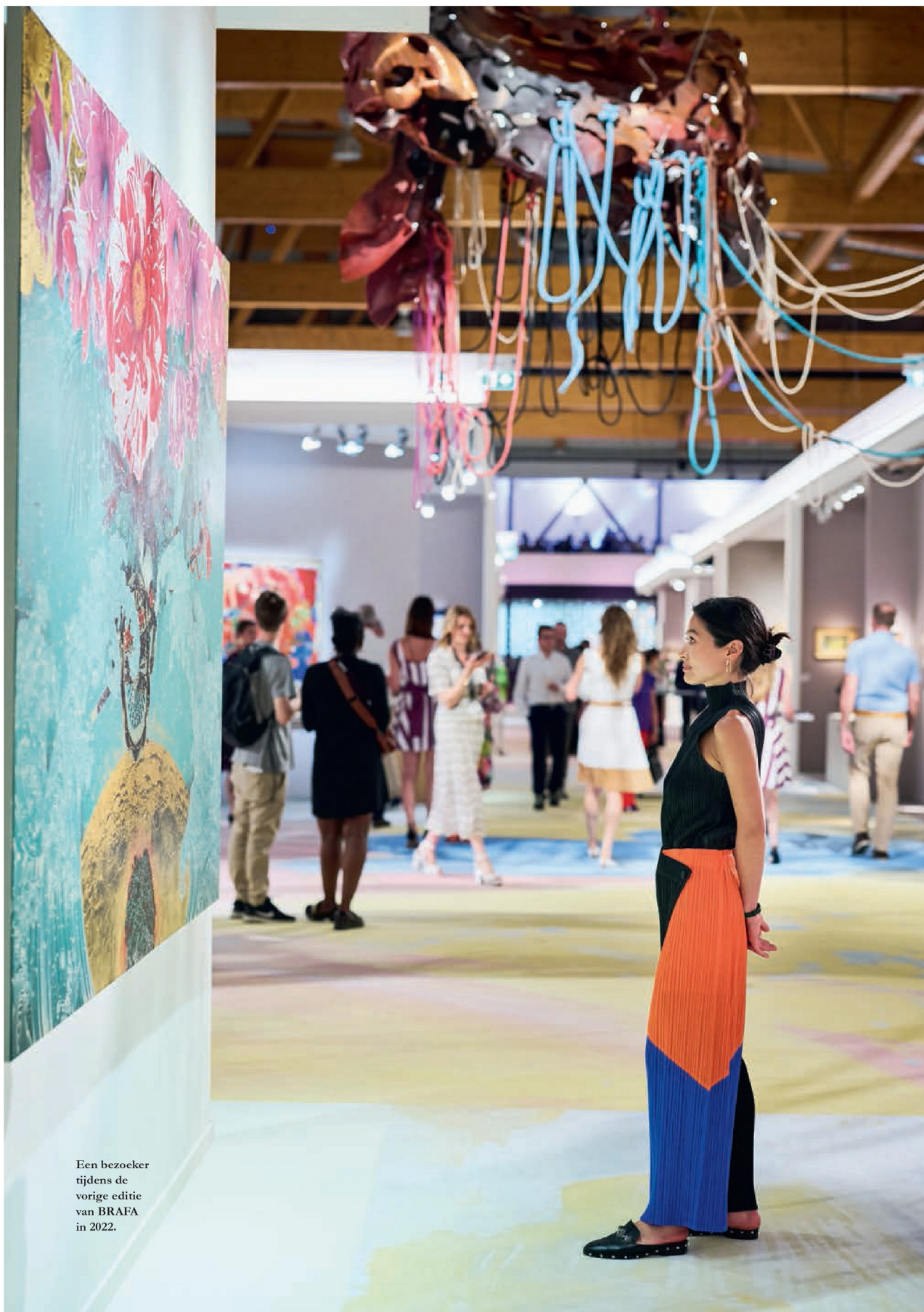
Een bezoeker tijdens de vorige editie van BRAFA in 2022.