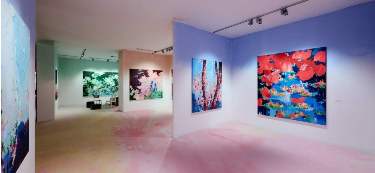
MARUANI MERCIER