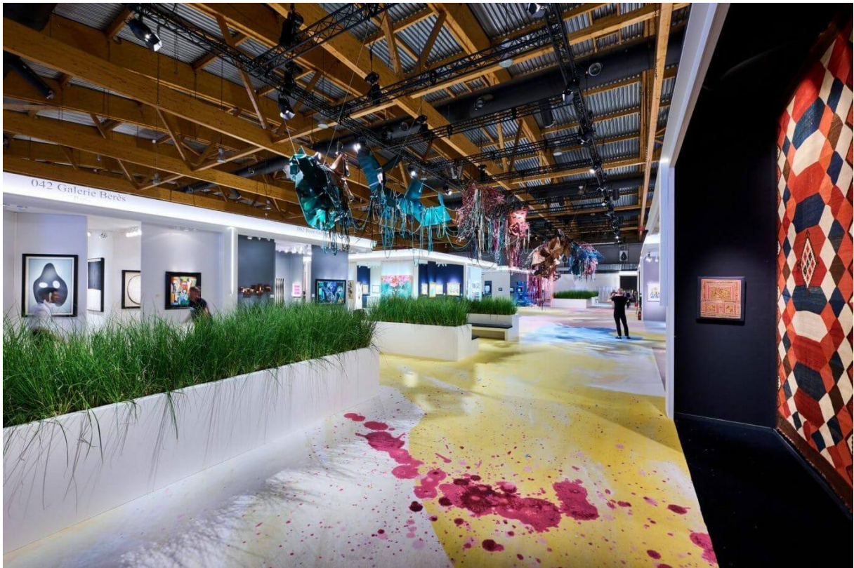
BRAFA Art Fair 2022-General view of the fair