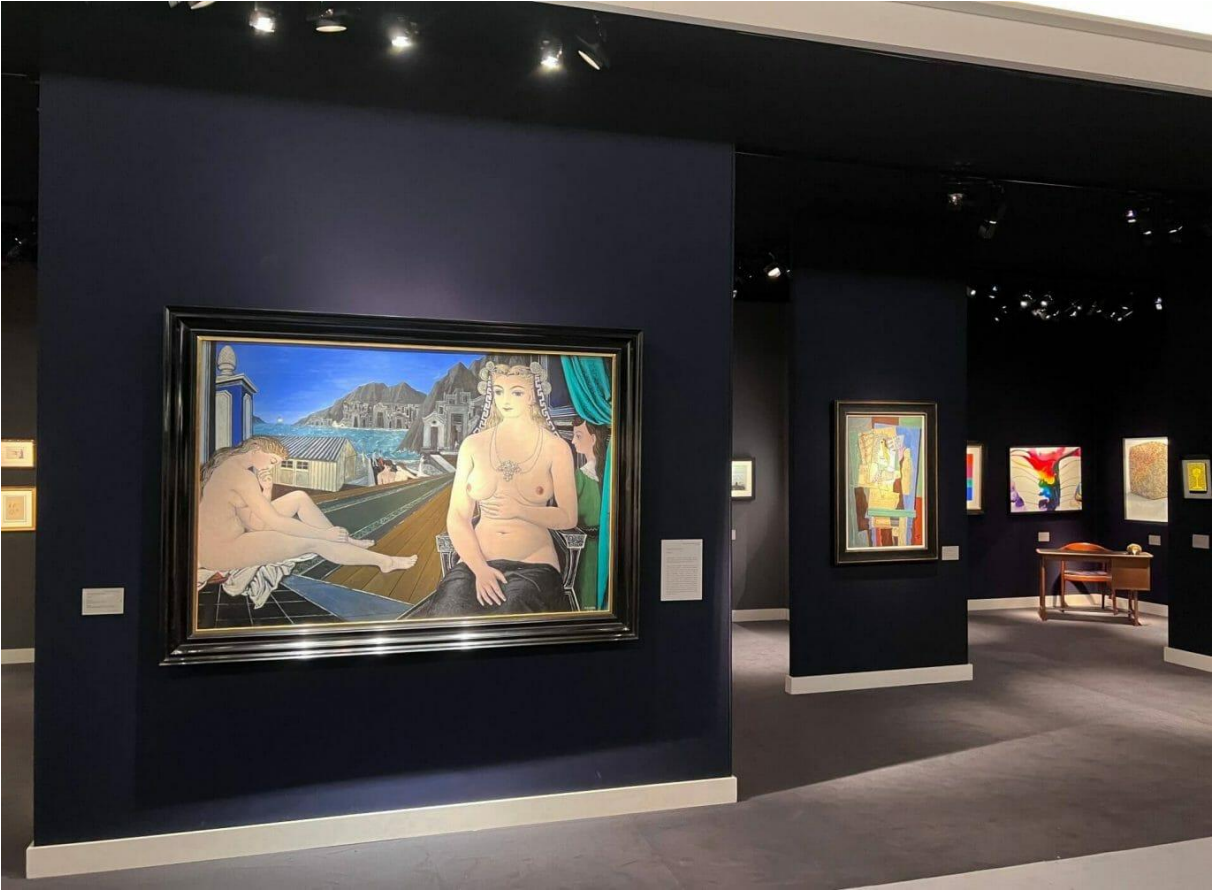
Stern Pissarro Gallery