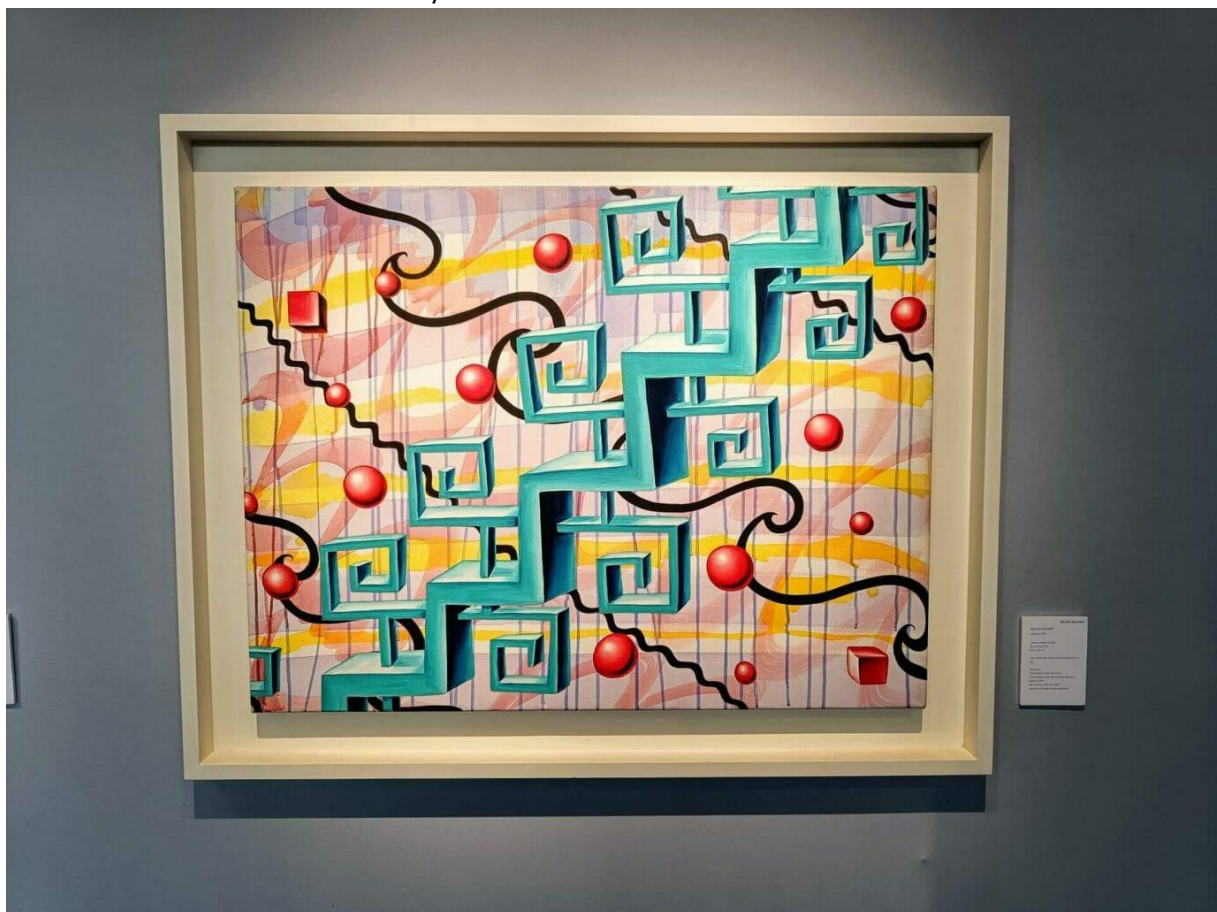
Schilderij van Kenny Sharf bij Galerie Bpulakia