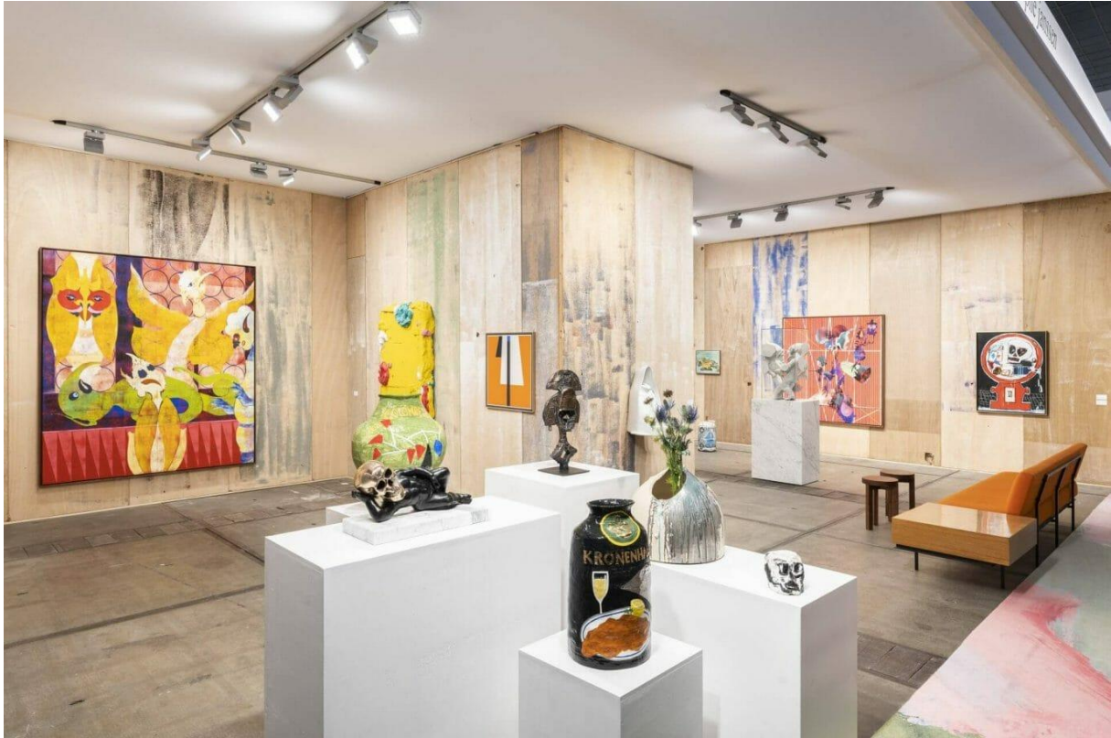
Rodolphe Janssen