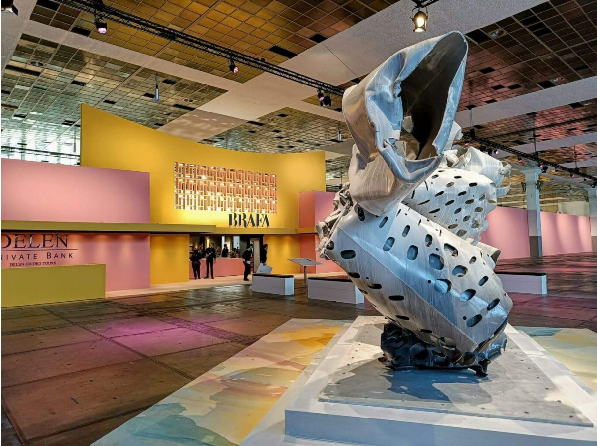
Voor de ingang staat een mooi werk van Arne Quinze

Tot en met zondag 26 juni is BRAFA weer te bezoeken in Brussel. Na een gedwongen pauze vanwege de internationale coronacrisis keert de kunstbeurs terug voor een zomereditie op een nieuwe locatie.