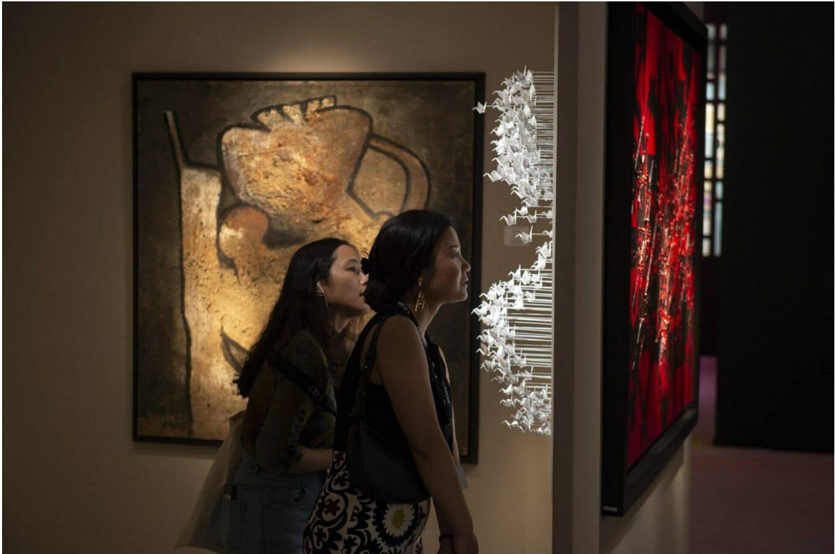
Galerie Hurtebize