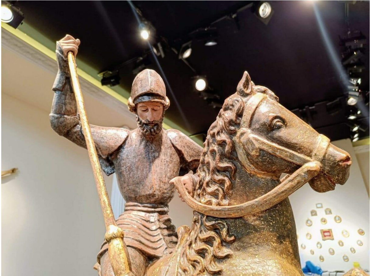
Houten beeld van Sint-Joris bij Chiale Fine Art