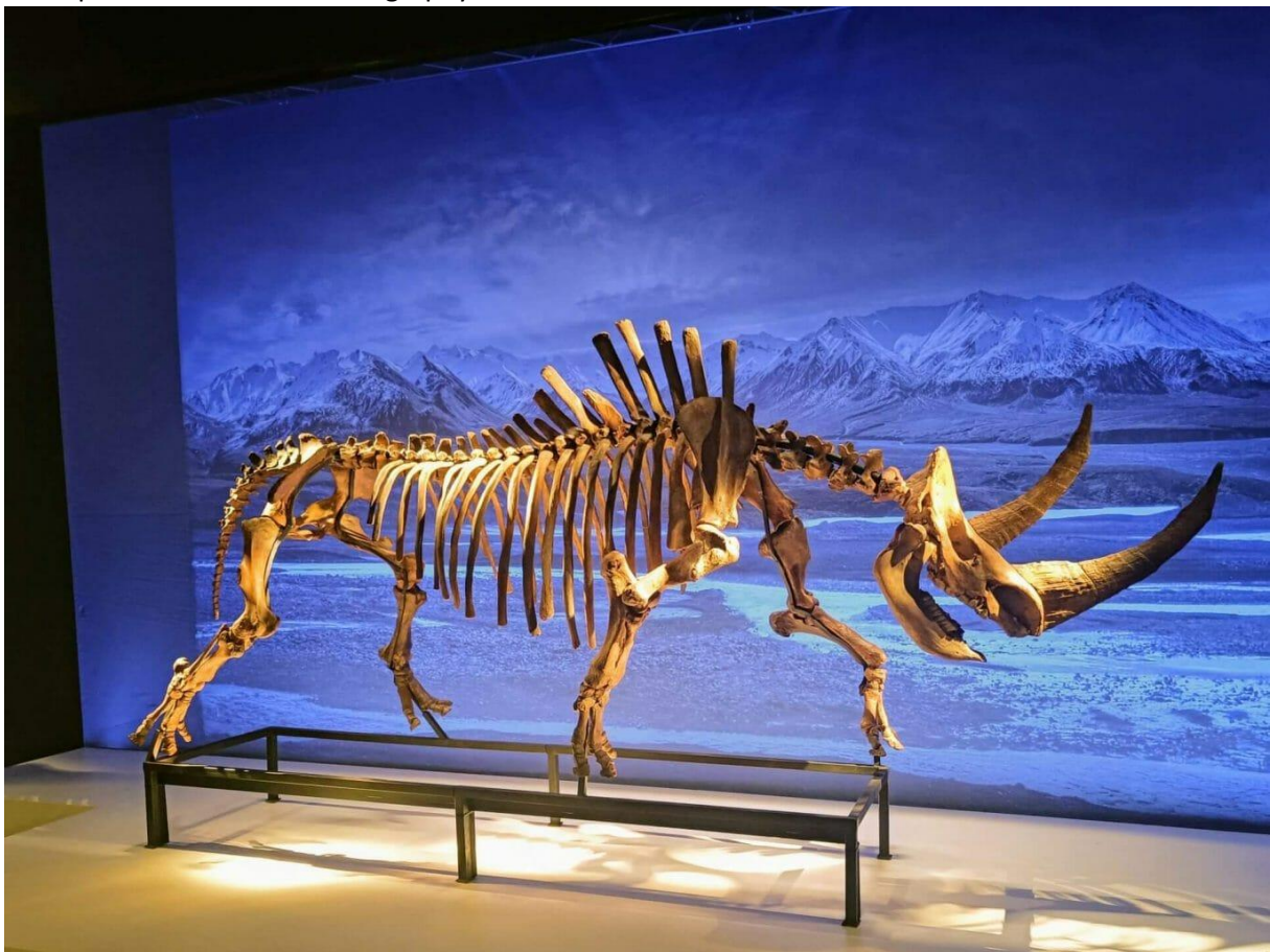
De Koning Boudewijnstichting toont het skelet van een wolharige neushoorn