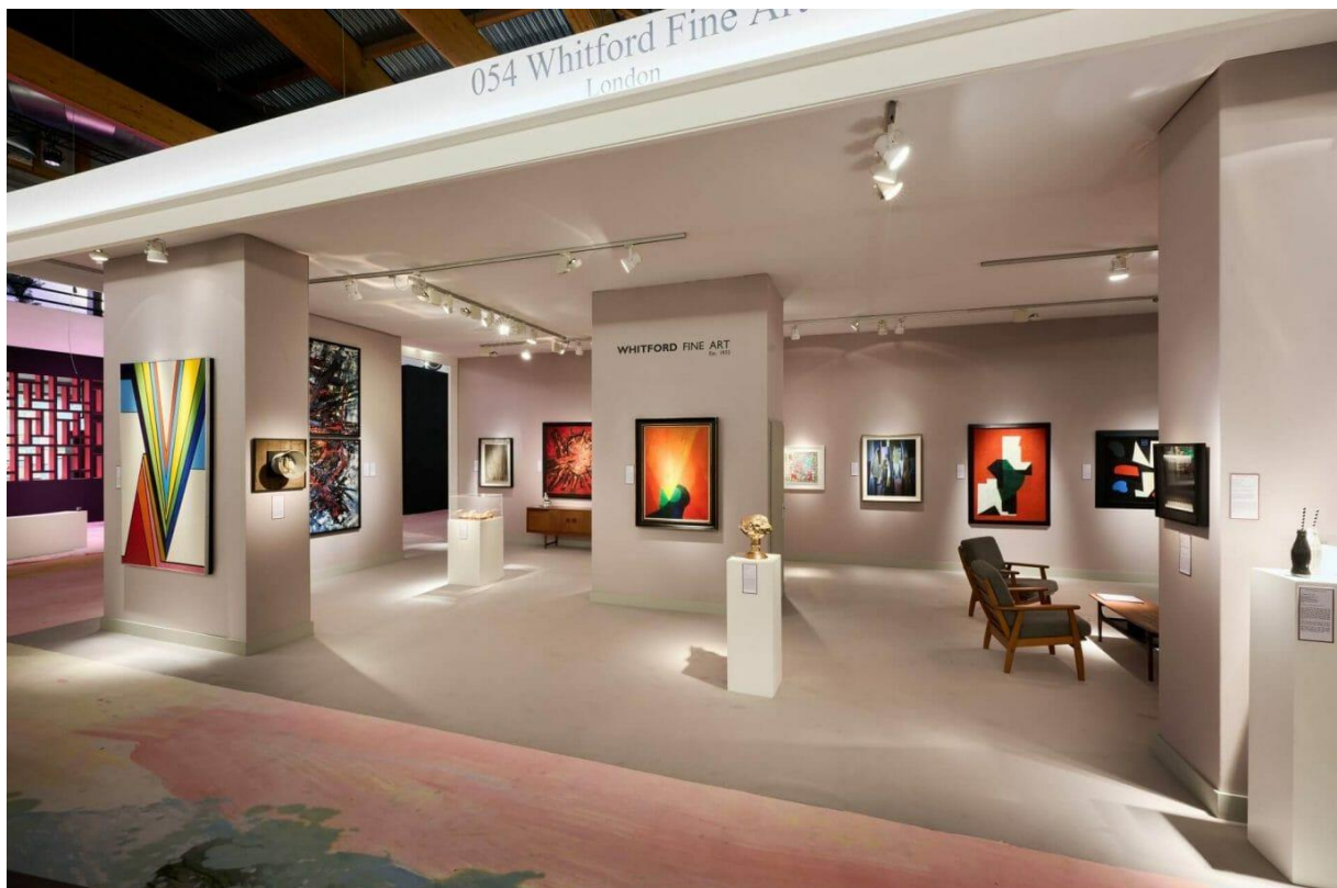
Whitford Fine Art © Fabrice Debatty