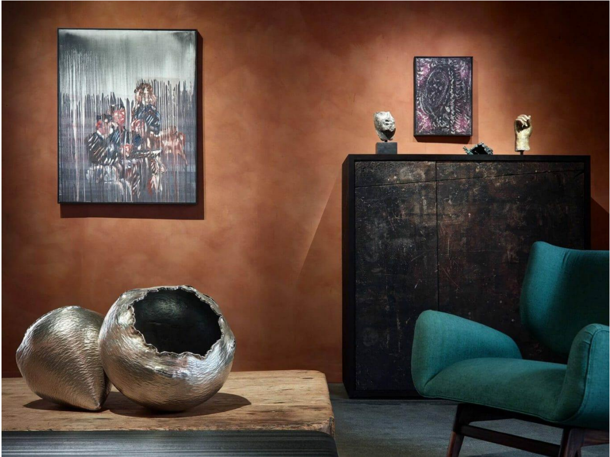
Axel Vervoordt