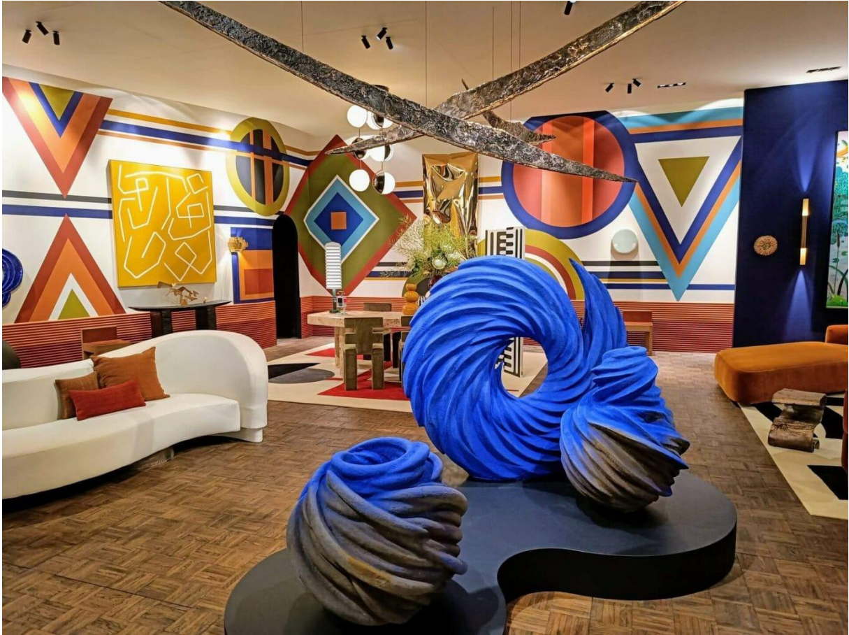
De eclectische stand van Delen Bank