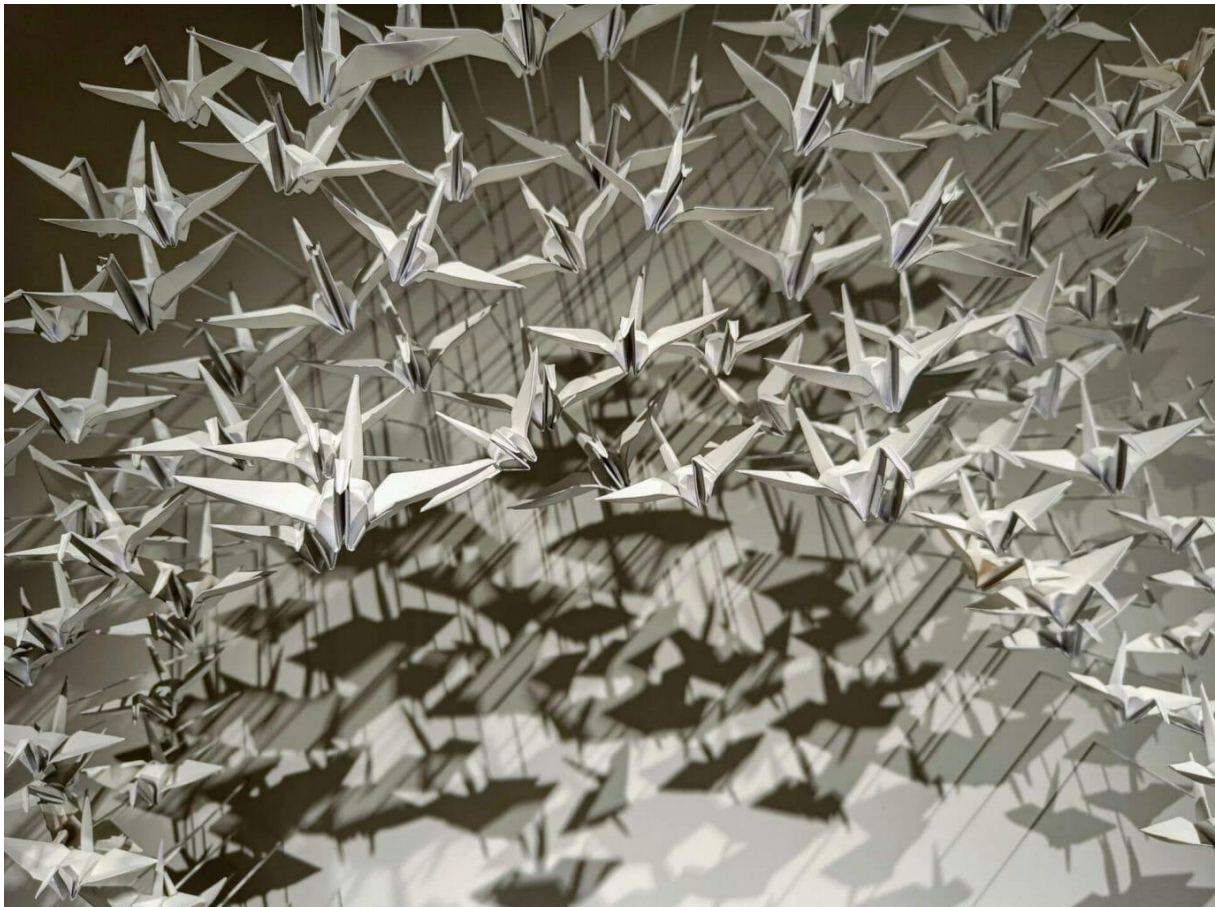
Detail van het werk Murmuration12, 2022 van Benjamin Gaumard. Te zien bij Galerie Hurtebize