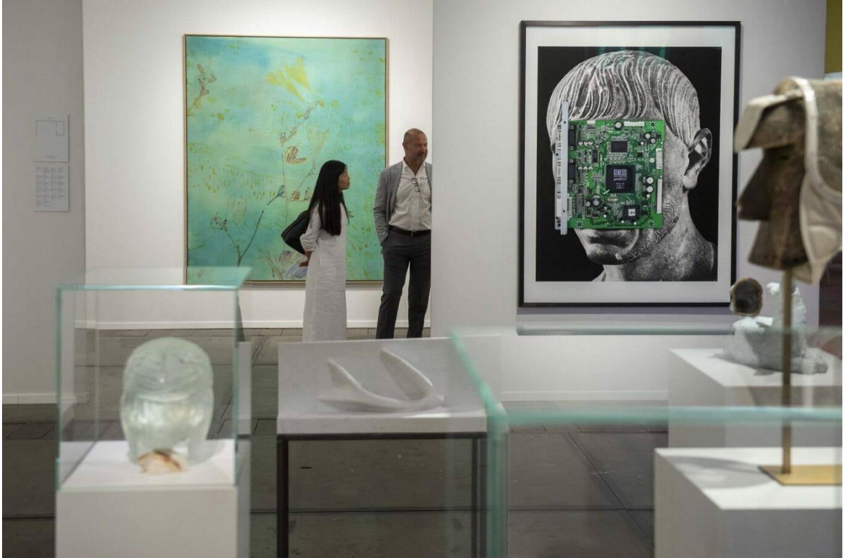
Meessen De Clercq © Emmanuel Croÿ