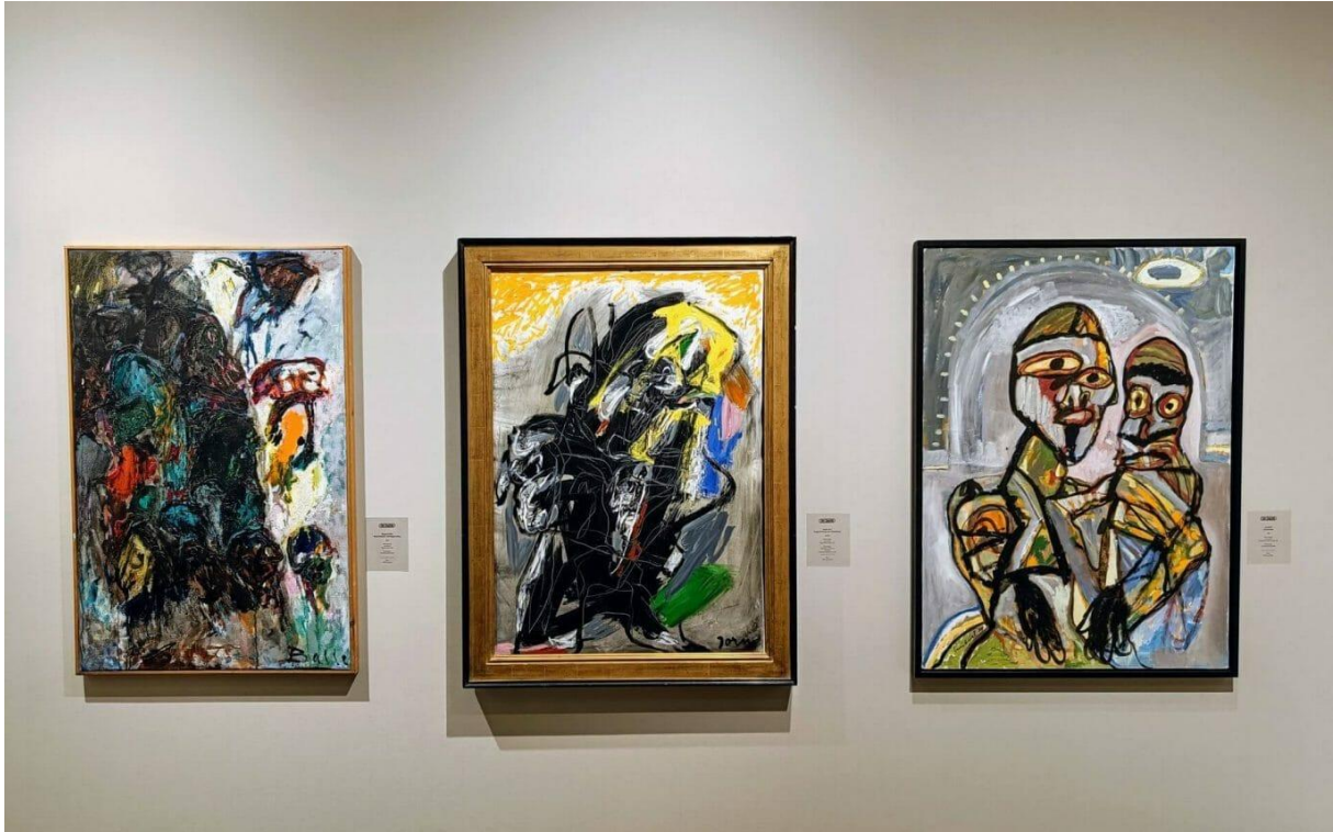
Schilderijen van Mogens Balle, Asger Jorn en Lucebert naast elkaar bij DIE Galerie